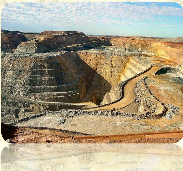
Золотой рудник у Калгурли