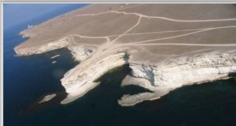
Обрывы Тарханкутского полуострова