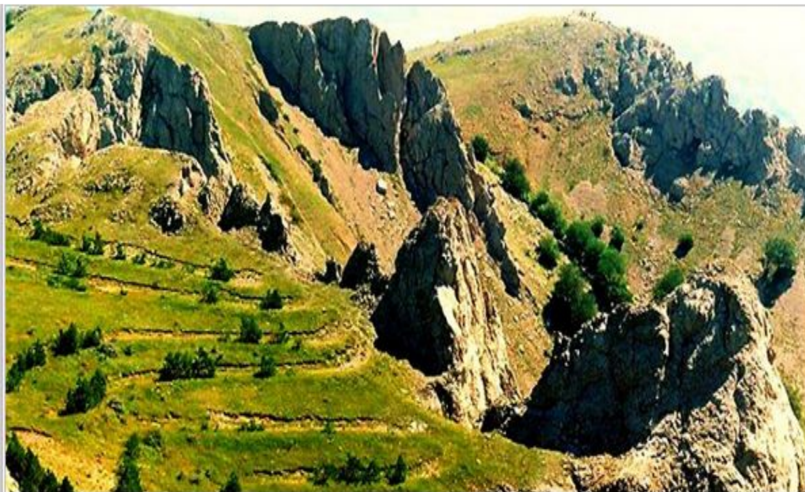
Караби-яйла высотой 600-1200 м: Тай-Коба (1283 м), Катран-Янкан-Тепе (1014 м)