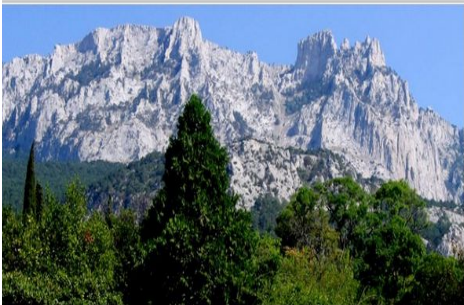
Ай-Петринская яйла высотой 1200-1300 м: г.Челяби (681 м), г. Атбаши над Симеизом (1196 м), г. Ай-Петри (1234 м), г. Беденекыр (1320 м)