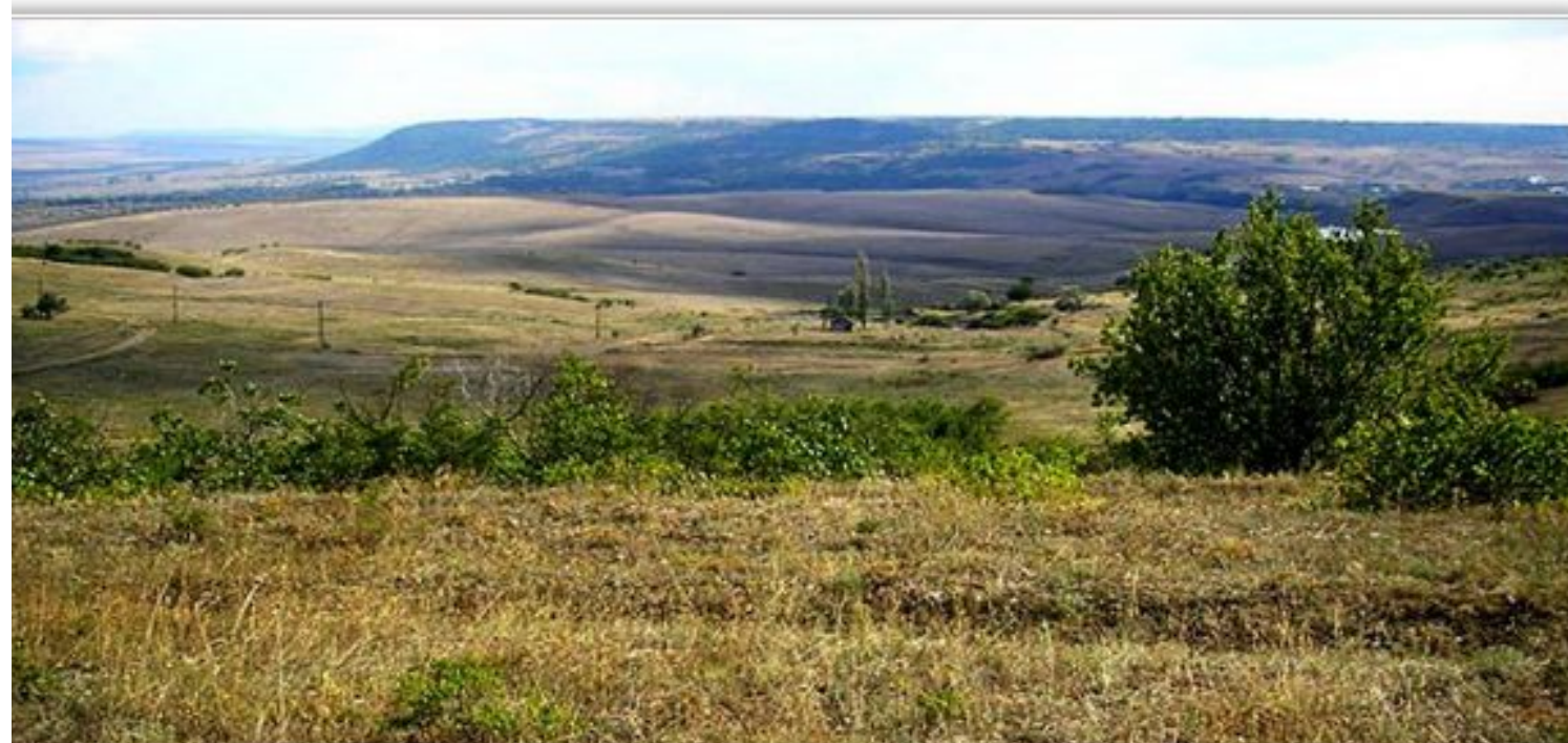
Внешняя гряда у Альминской долины

Внешняя предгорная гряда протянулась на 90 км от массива Фиолент (хребет Кара-Агач), через Сапун-гору (220 м), с. Крепкое, Верхне-Садовое, Долинное на реке Кача, Симферополь (Завокзальные высоты), Н.Мазанка, Донское. Далее наблюдаются лишь её фрагменты. Средняя высота Внешней предгорной гряды составляет 250 м, максимальная - 349 м (г. Казан-Таш).