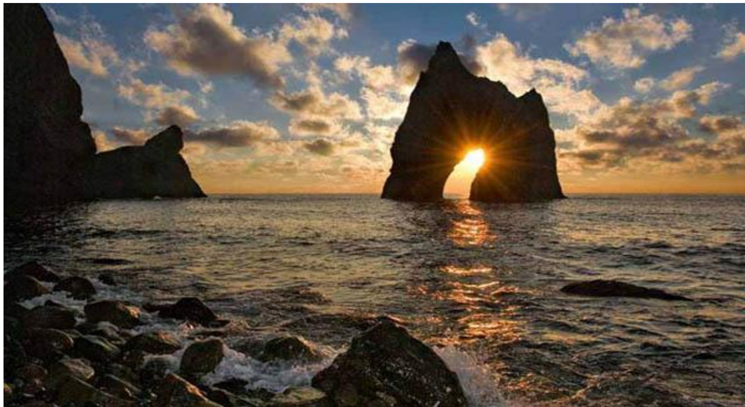
Золотые ворота Карадага