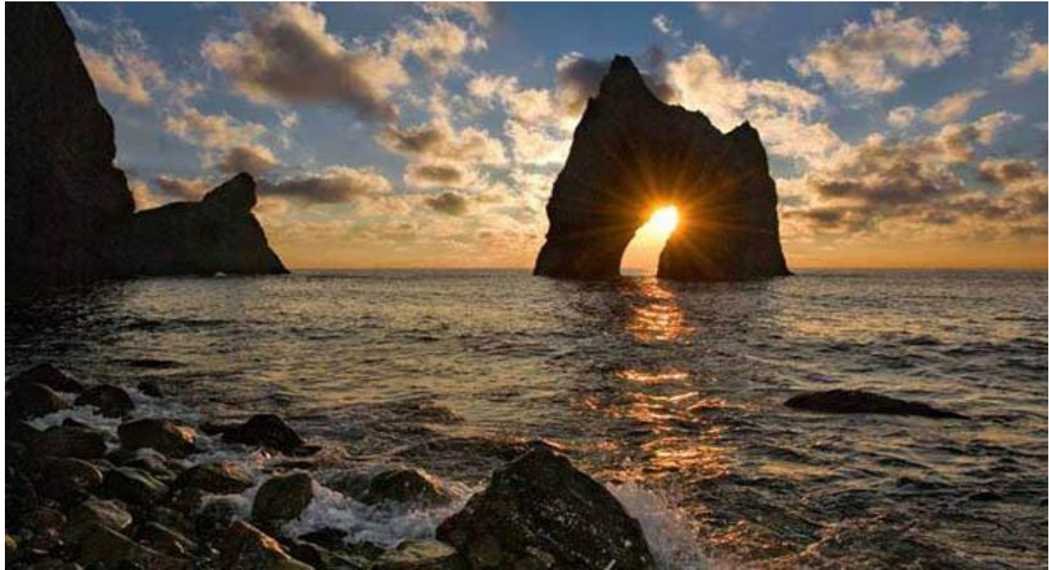
Золотые ворота Карадага