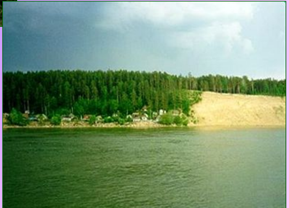
Обь на равнине