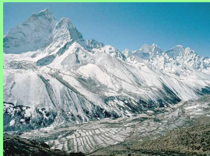
Горы Гималаи Г. Килиманджаро