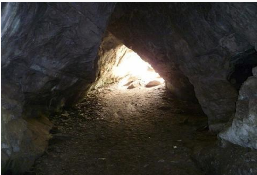
Пещера Кек- Таш