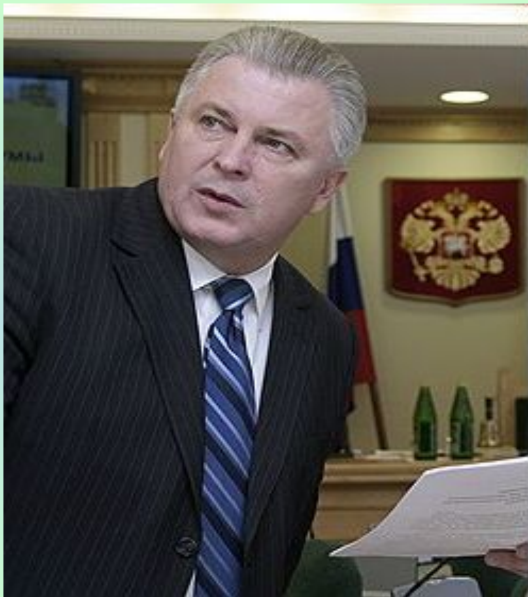
Президент Республики Бурятия- Ноговицын В.В.