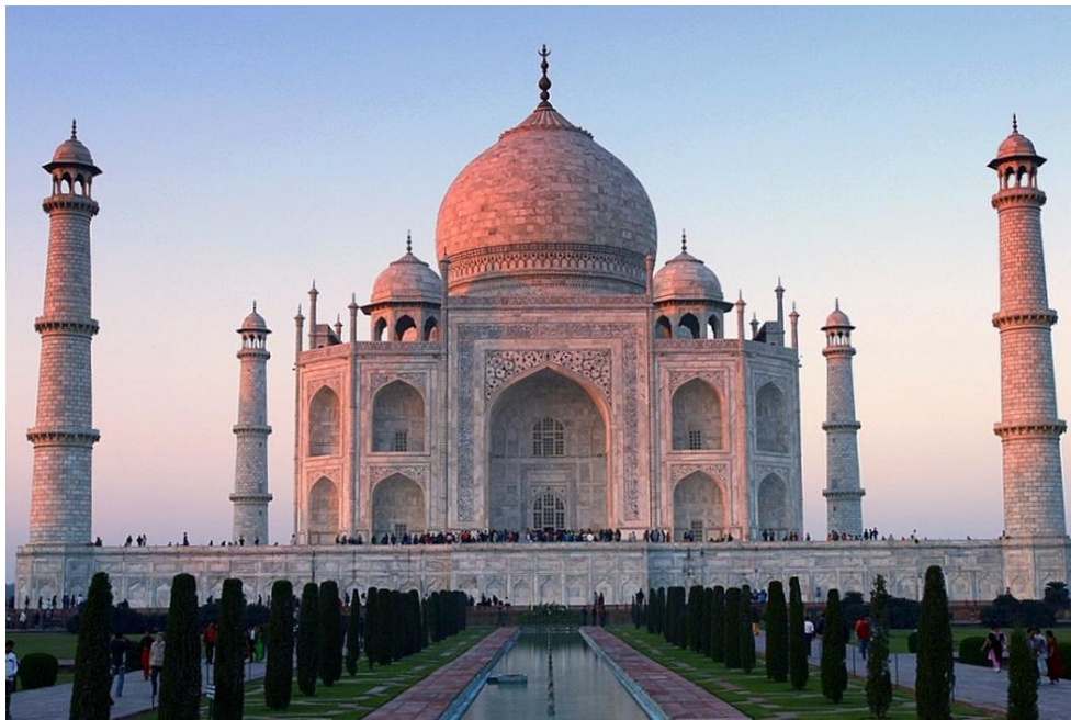
Тадж - Махал