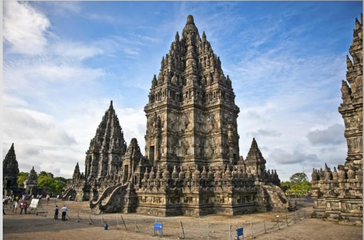
Храмовый комплекс Прамбанан

В частности, на 2012 год в стране имелось 8 объектов, включённых в список Всемирного наследия ЮНЕСКО