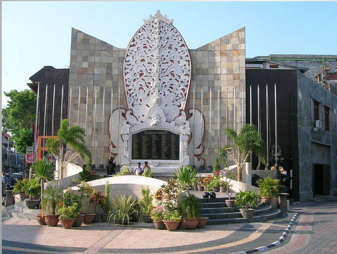
Памятник жертвам теракта 12 октября 2002 года на острове Бали

По оценкам правительства и руководства силовых структур страны, основные угрозы её национальной безопасности носят внутренний характер. Важнейшими из них являются межэтнические и межрелигиозные конфликты и связанные с ними проявления терроризма и экстремизма