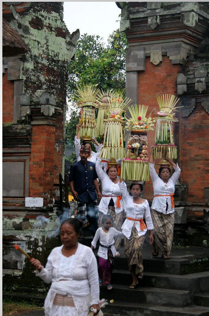
Приношения в индуистский храм, остров Бали