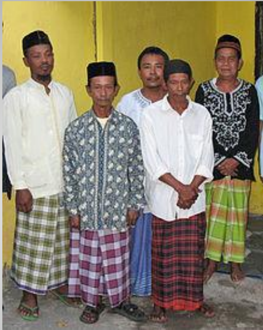
Яванцы, представители крупнейшего народа Индонезии, в национальной одежде