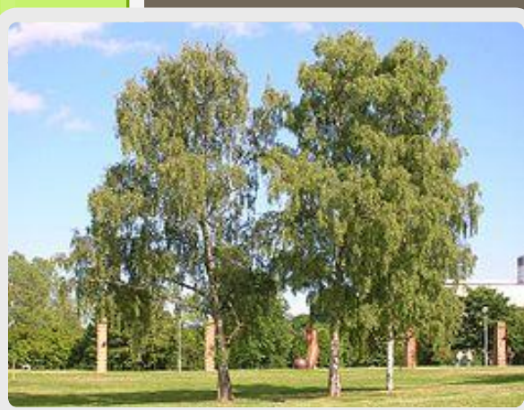
Берёза повислая или бородавчатая