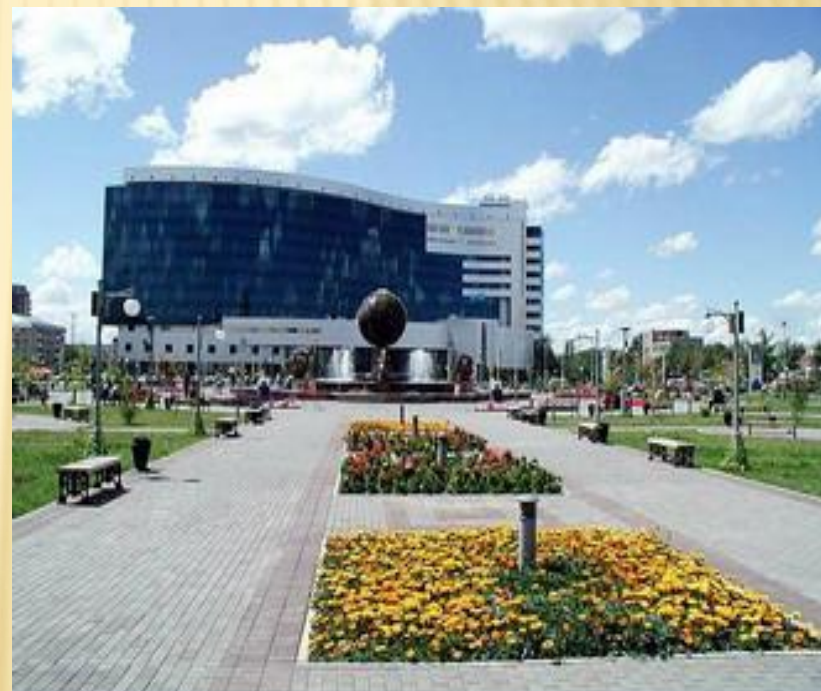
Астана – столица Республики Казахстан