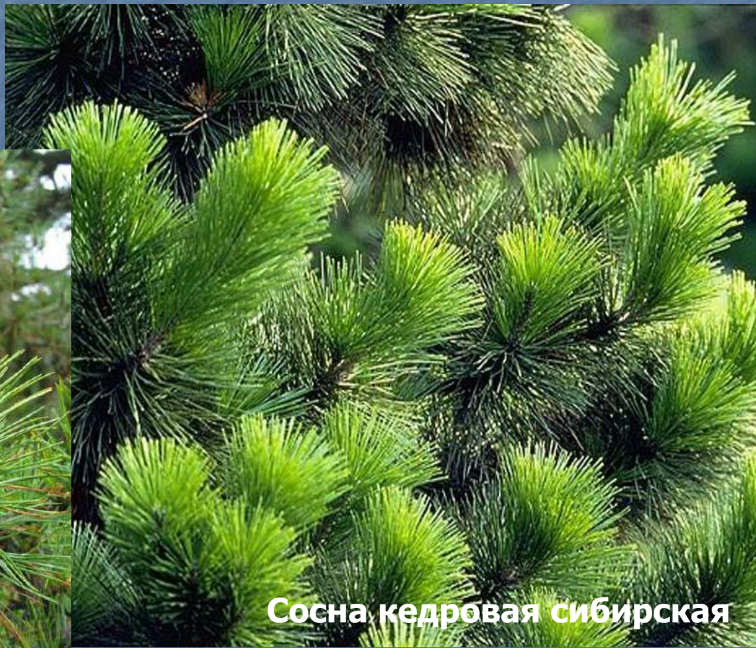
Сосна кедровая сибирская