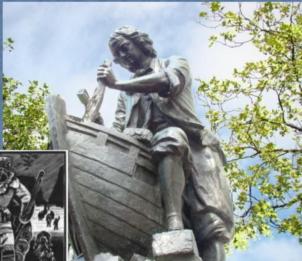
Памятник Петру I в г. Заандаме