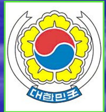
Герб республики Корея