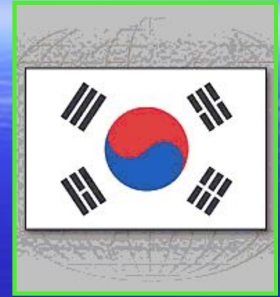
Флаг Республики Корея