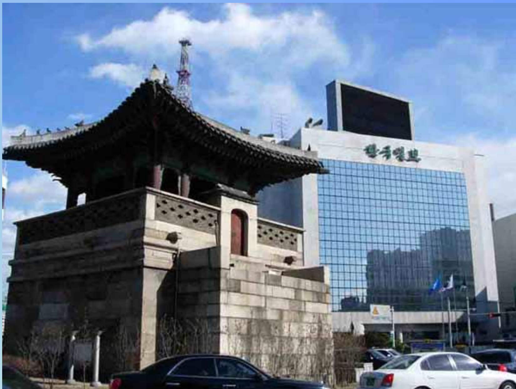
Сеул – столица Республики Кореи (10,7 млн. чел.).