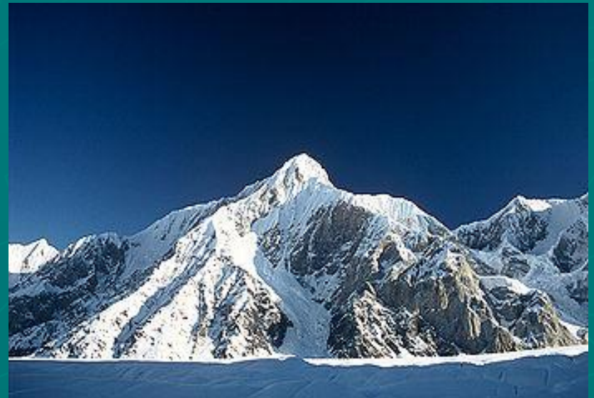
Пик Горького на Тянь-Шане