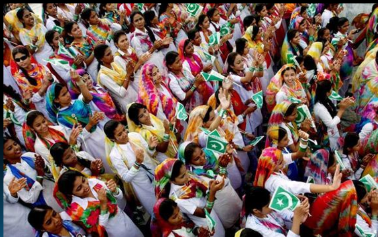
День независимости в Пакистане