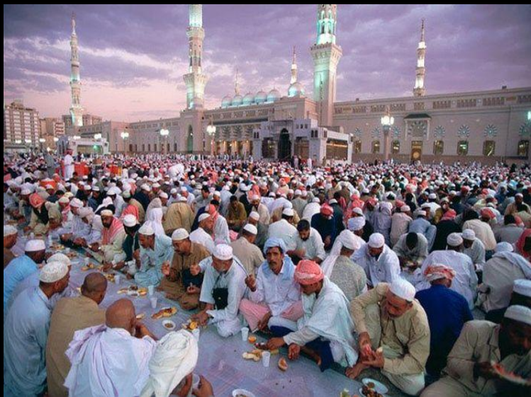
День окончания поста Рамадан