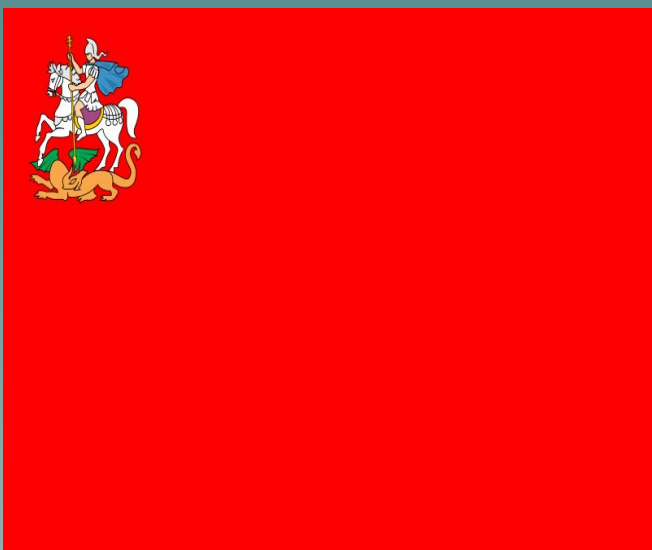
Громов Борис Всеволодович