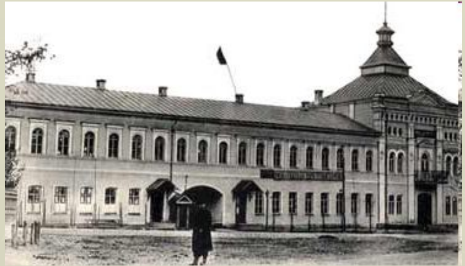
Женская гимназия. Начало XX века.