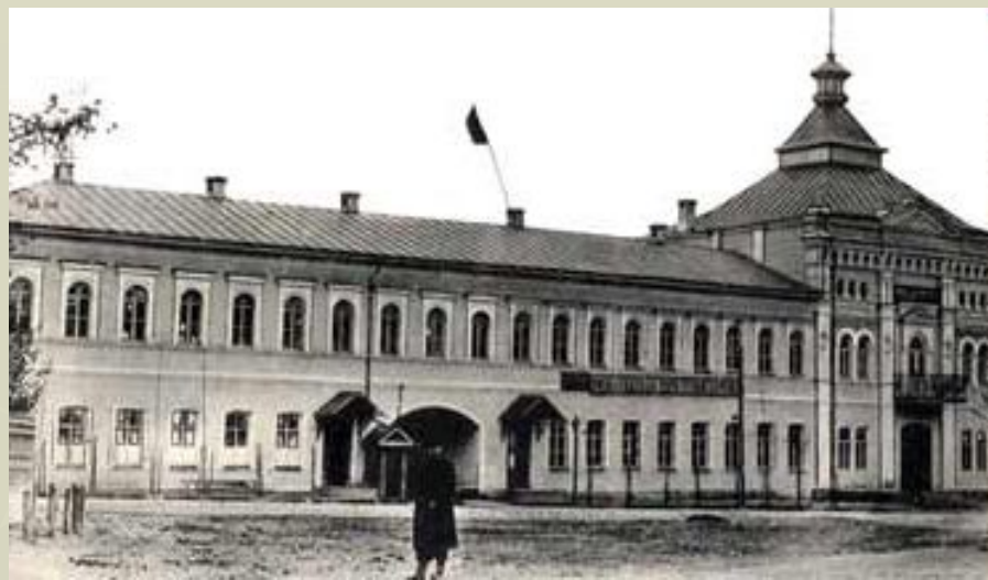
Женская гимназия. Начало XX века.