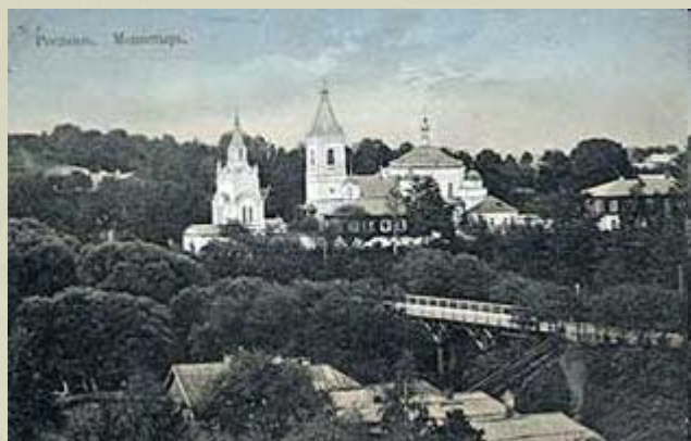
Спасо-Преображенский монастырь. 1908 г.

Самый крупный архитектурный комплекс города - Спасо-Преображенский монастырь - занимает значительное место в панораме современного Рославля и является хранителем духовности рославльчан.