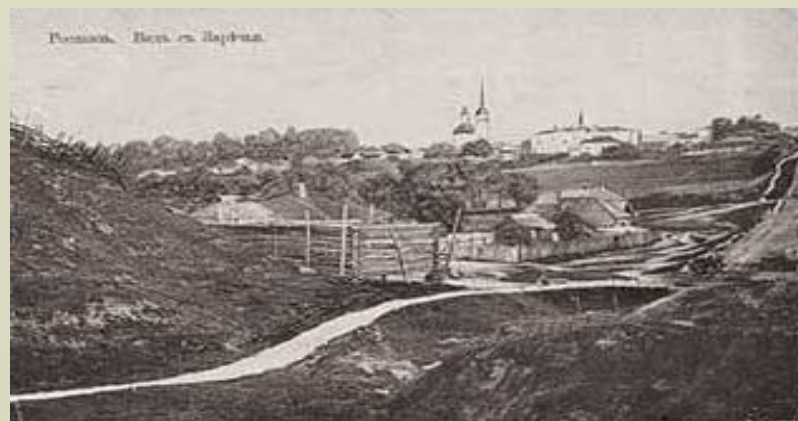
Вид с Заречья. Начало XX века.

За рекой Становкой раскинулась та часть города, которая носит название Заречье. Её заселение началось только во второй половине XVII века. Долгое время на этой территории, среди дремучих лесов и низких домиков выделялся один Спасо-Преображенский мужской монастырь, известный до 1560 года.