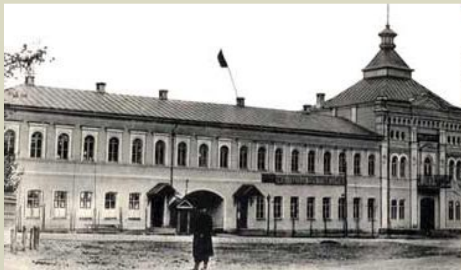
Женская гимназия. Начало XX века.