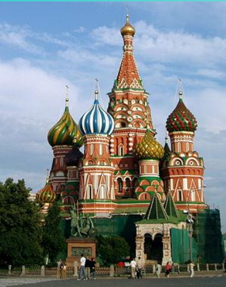
Собор Василия Блаженного