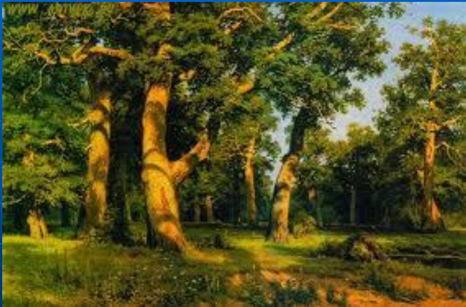
И.И. Шишкин «Дубовая роща», 1887