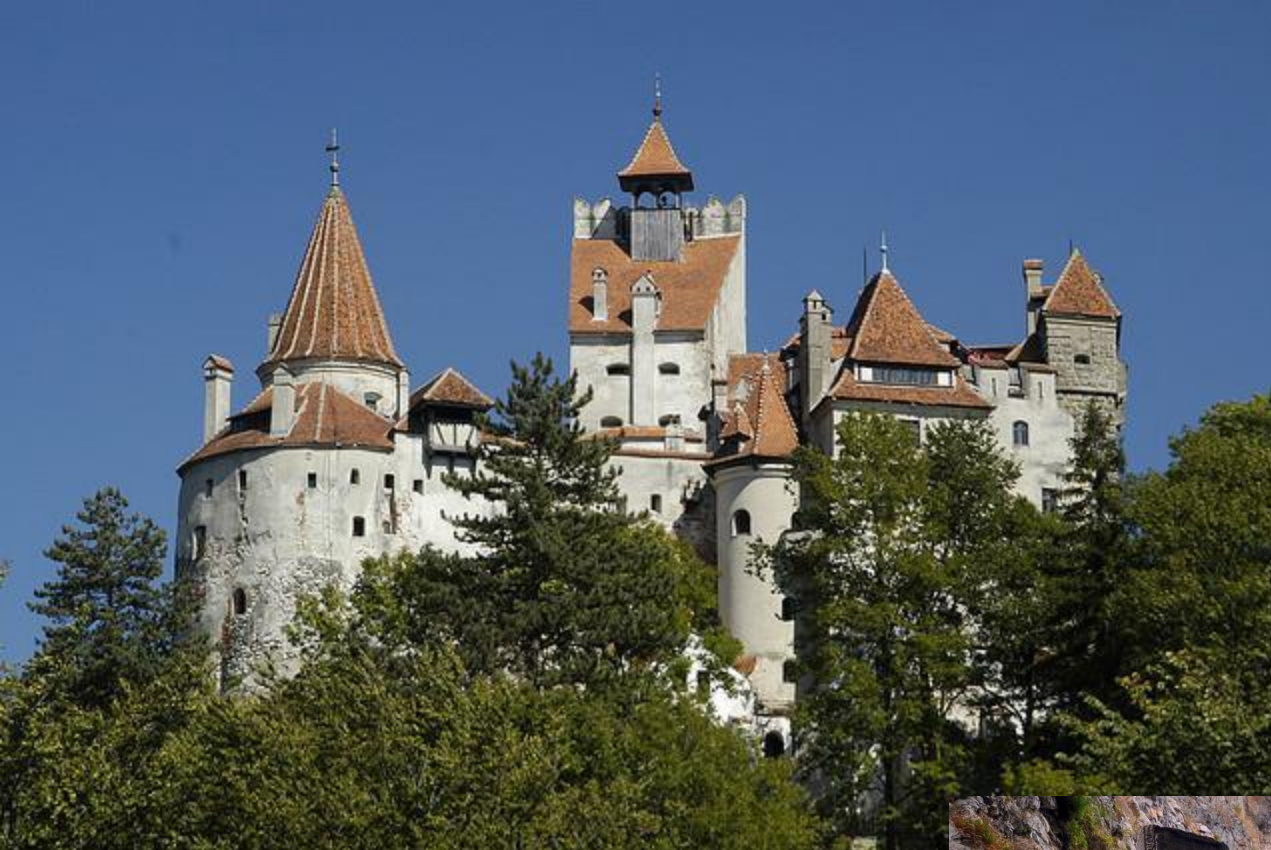
Замок Дракулы, Румыния