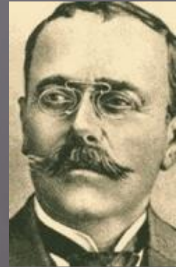
драматург И.Л. Караджале

литературные критики Т.Майореску и К. Доброджану-Геря.