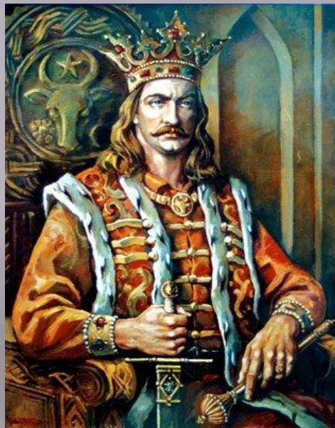
Стефан III Великий Молдове

С XI века Трансильвания обладала автономией в составе Венгерского королевства, в XVI веке стала независимым княжеством и оставалась им до 1711 года. В 1541 году в ходе битвы при Мохаче венгерские войска были разгромлены, и Валахия, Молдавия и Трансильвания попали под вассалитет Османской империи, при этом сохраняя внутреннюю автономию до середины XIX века. Для этого периода характерно постепенное отмирание феодальной системы.