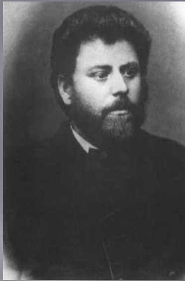
талантливый и сказочник И. Крянгэ