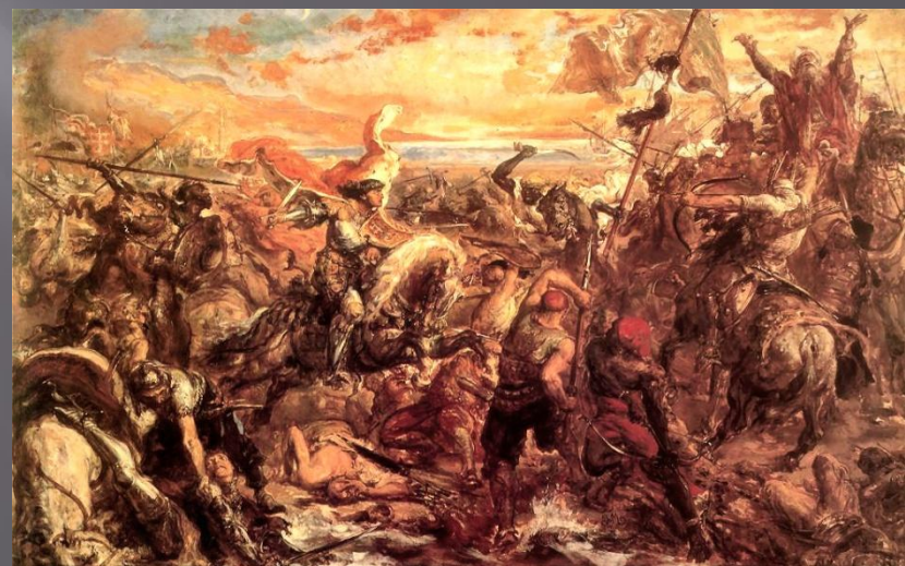
Янош Хуньяди в Трансильвании