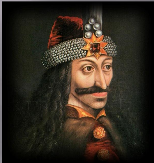
Влад III Цепеш (Дракула) в Валахии