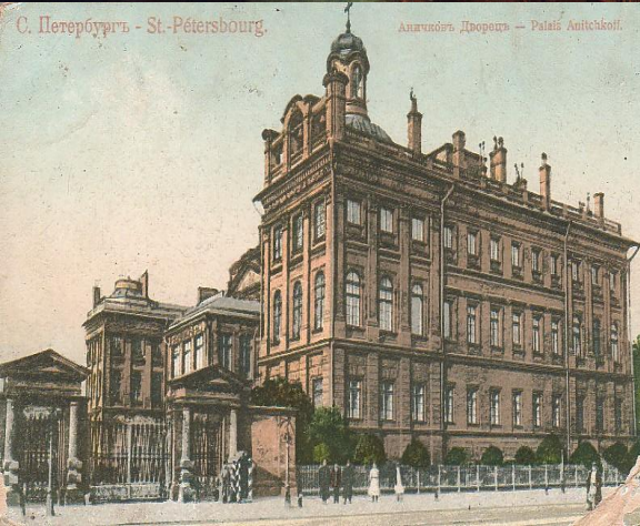
С. Петербург - St. Pétersbourg