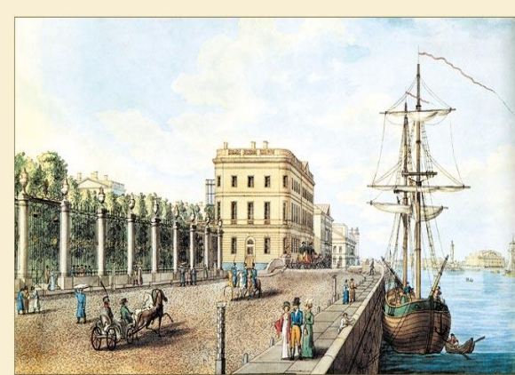
Набережная Невы у летнего сада Рисована с гравюры. 1820-е г.

1) место расположения , от которого зависит удобство доступа к отелю и привлекательность его окружения (инфраструктуры) для гостя, которая зависит во многом и от цели посещения.