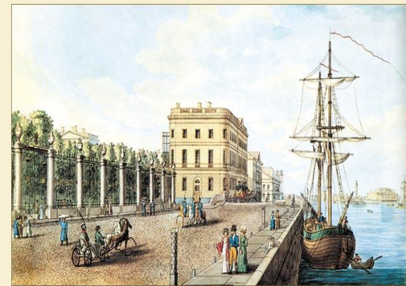
Набережная Невы у летнего сада Рисована с гравюры. 1820-е гг.

1) место расположения , от которого зависит удобство доступа к отелю и привлекательность его окружения (инфраструктуры) для гостя, которая зависит во многом и от цели посещения.