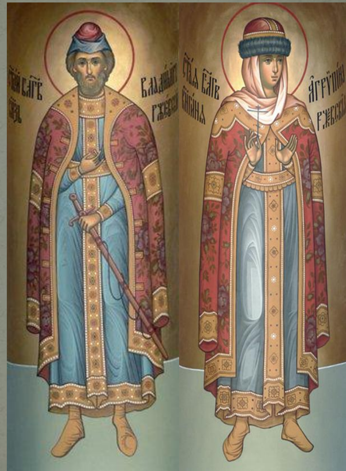
Святые кн. Владимир и кнг. Агрипина ржевские.