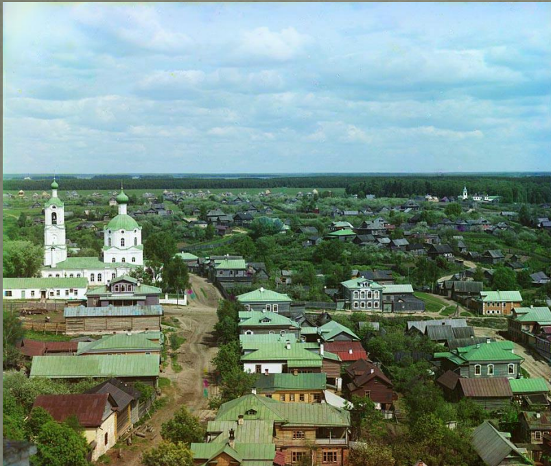
Князь-Федоровская сторона с церковью Покрова Пресвятой Богородицы. Фото 1910 г.

князь Федор Волоцкий и князь Дмитрий Углицкий, нач.16 в.