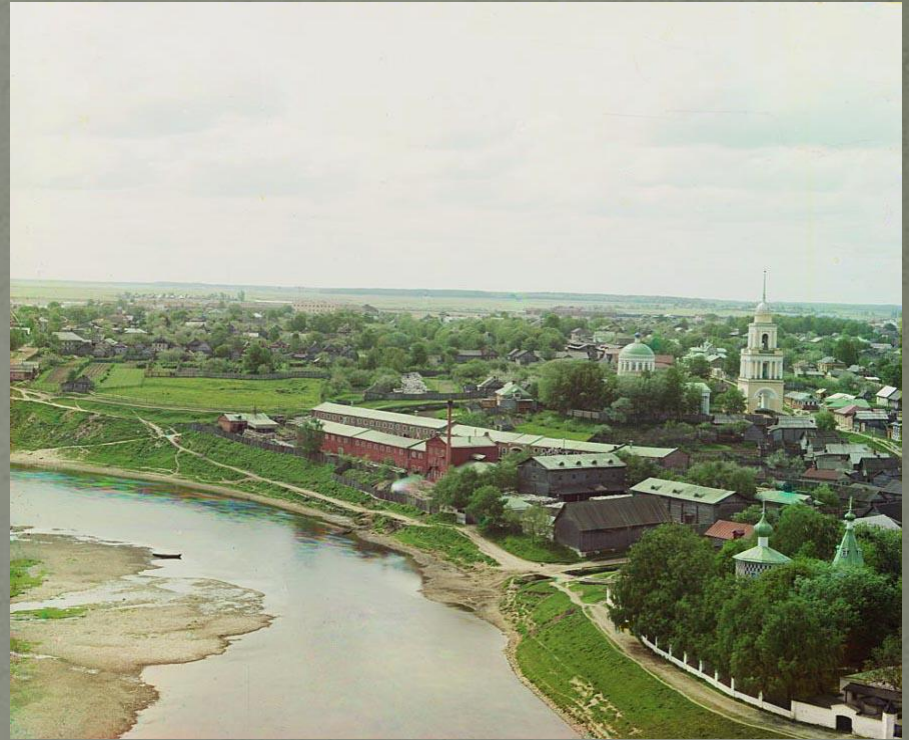
Князь-Дмитриевская сторона с (Оковецкой церковью). Фото 1910 г.