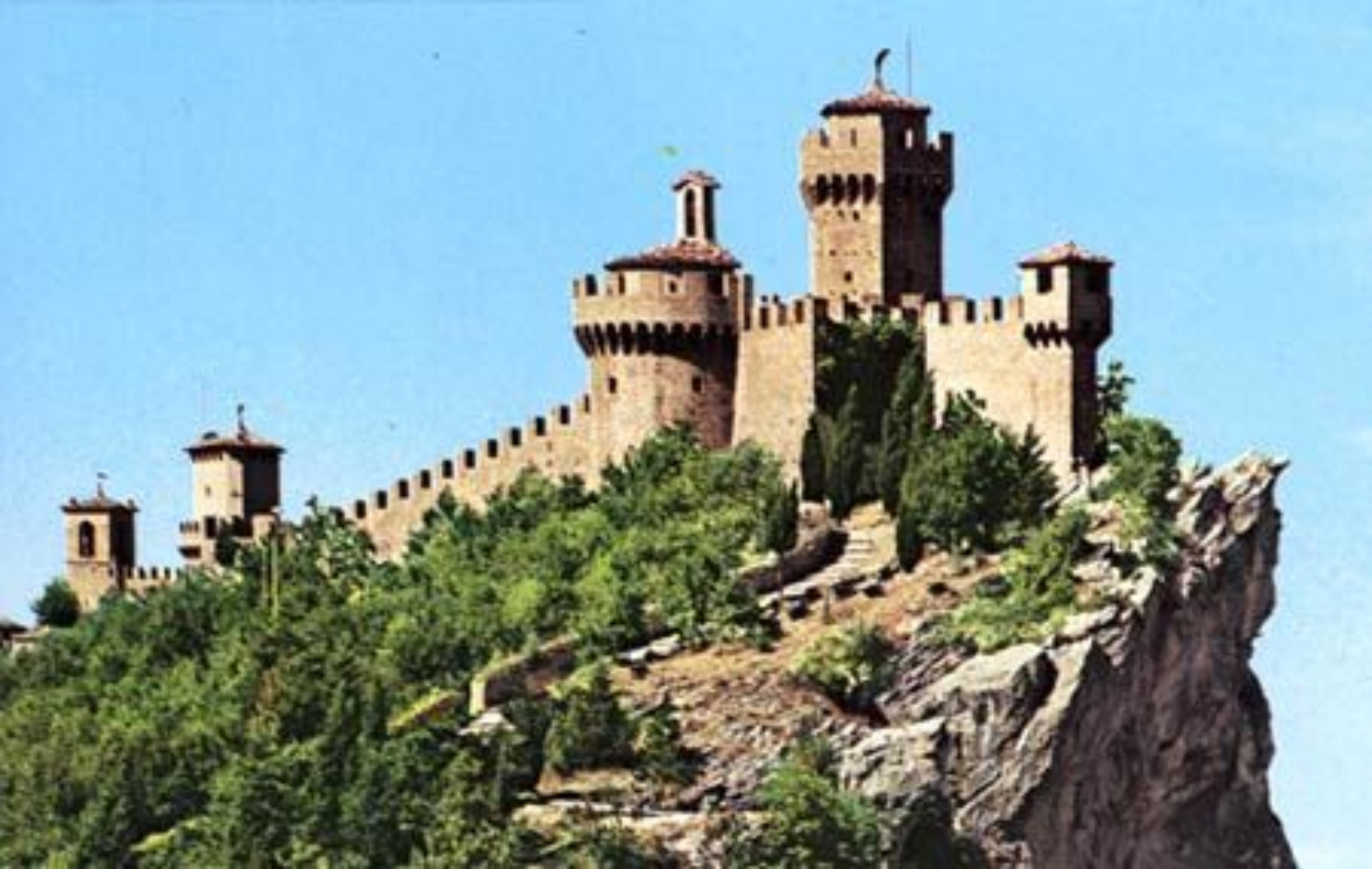
Крепость Честа или Фратта