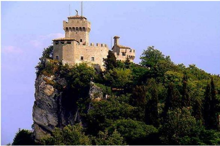
Замок в Сан-Марино