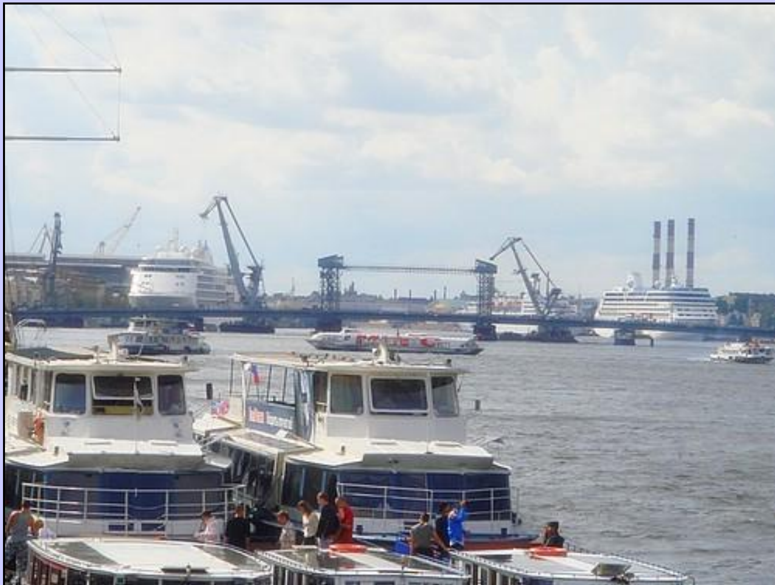
Порт на Неве реке