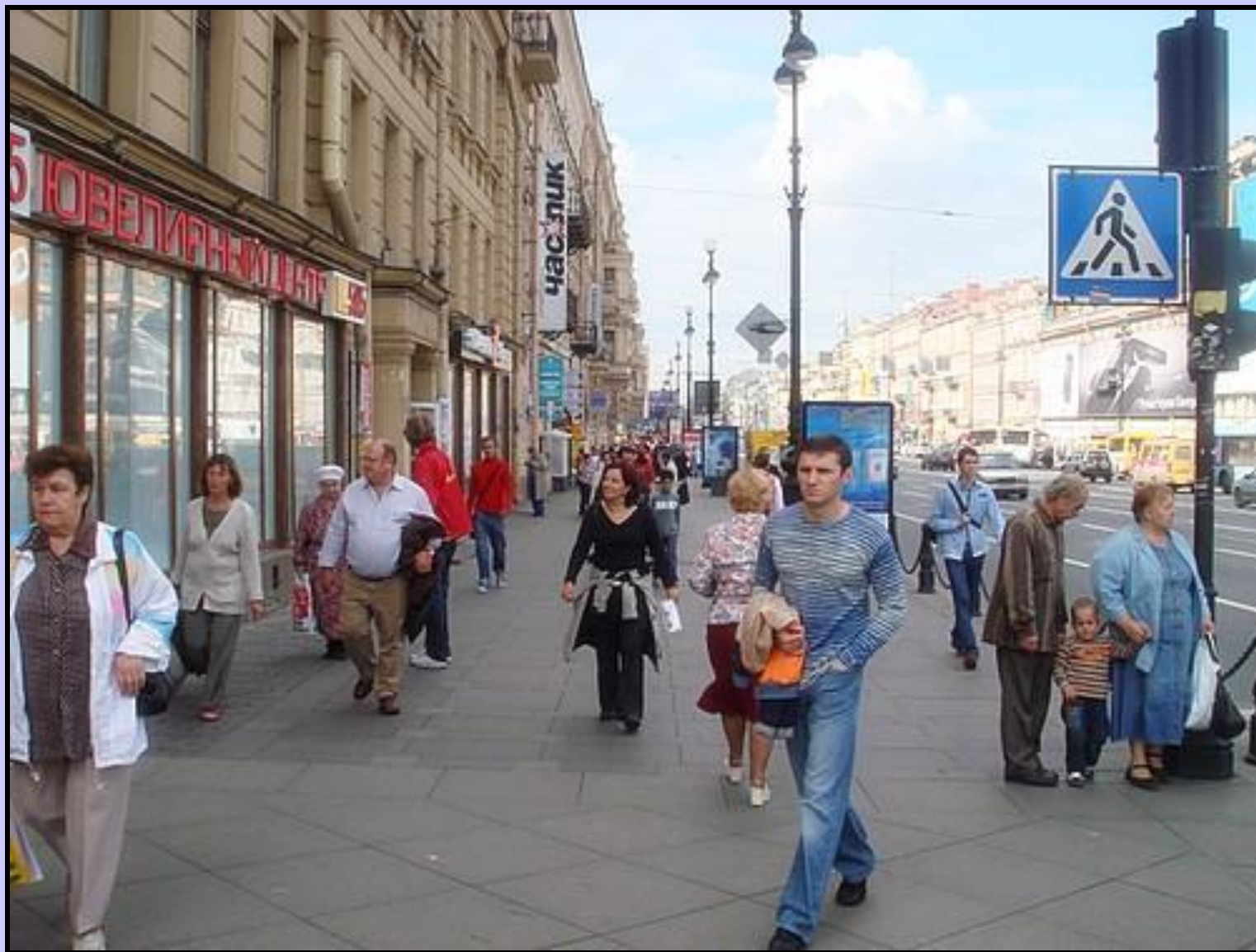
Центральная улица – Невский проспект