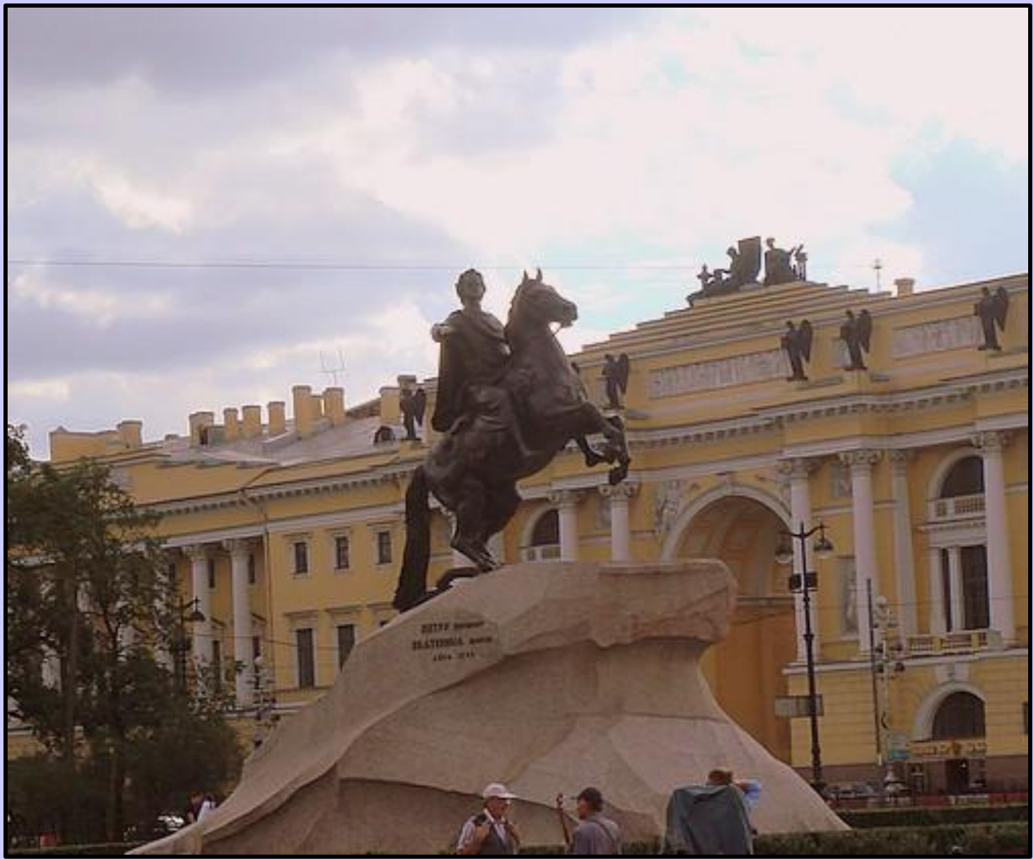
Памятник Петру ■