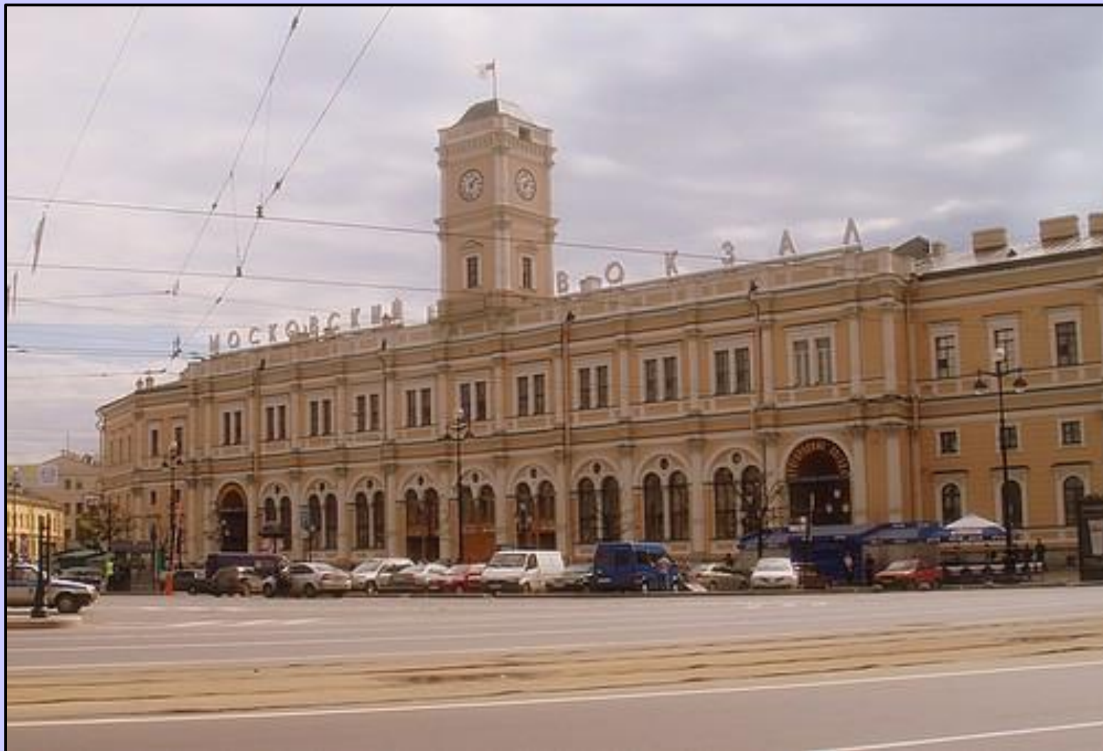
Московский Железнодорожный вокзал