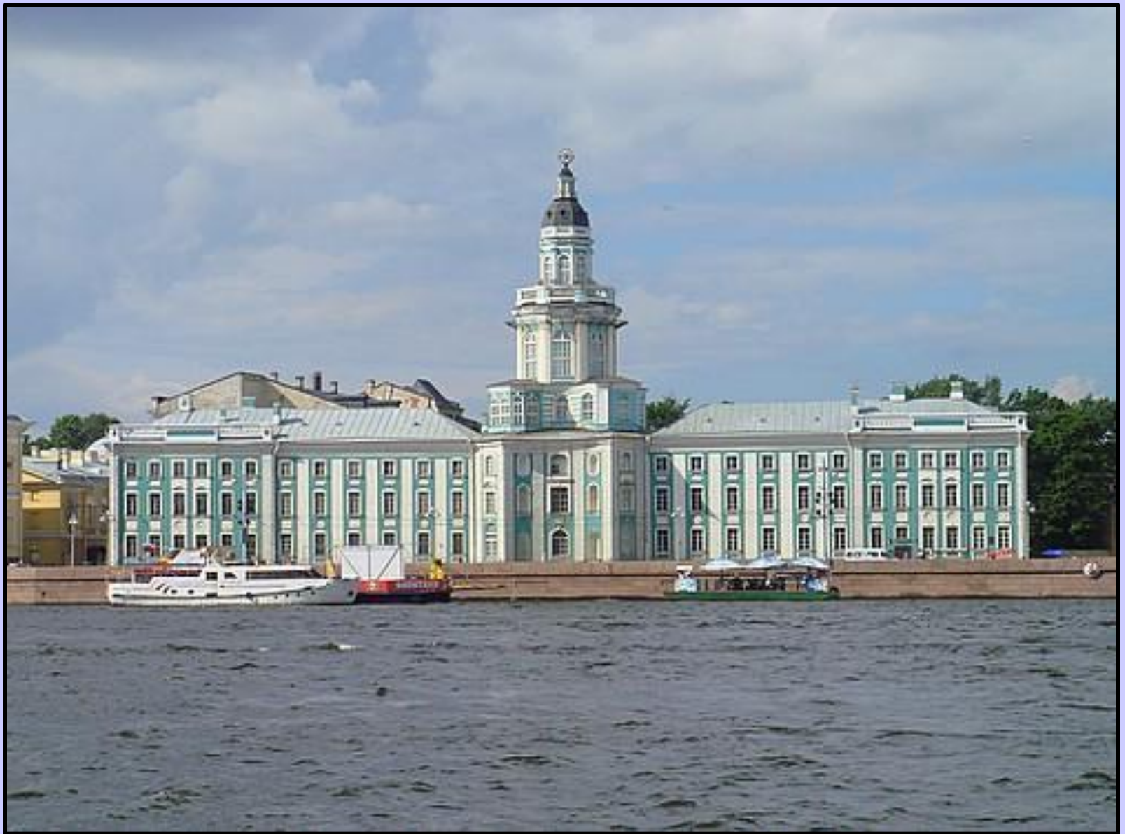
Музей антропологии и этнографии им. Петра Великого