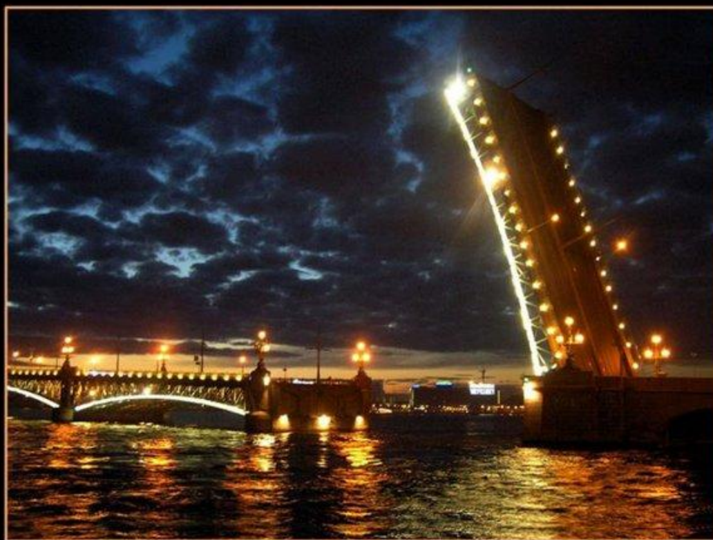
Светом Петербурга. Дворцовый мост.