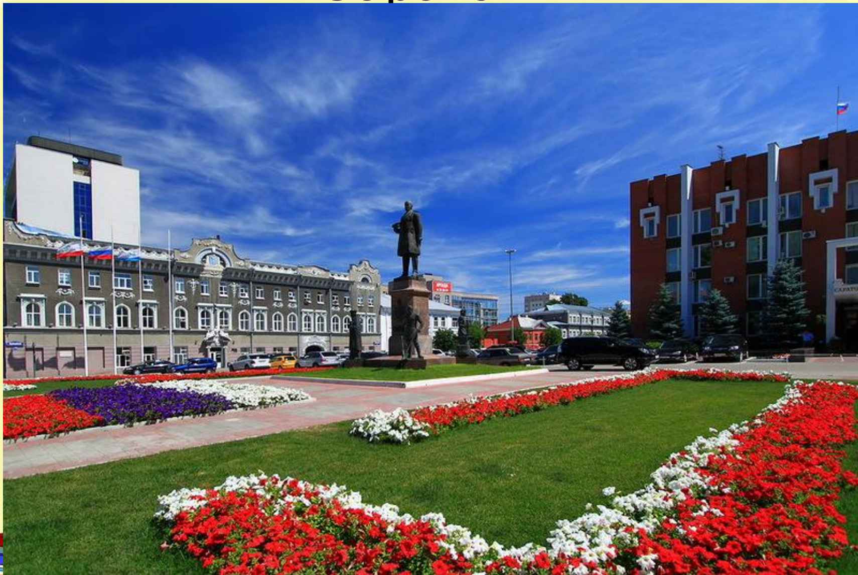
Площадь Столыпина, слева Мэрия