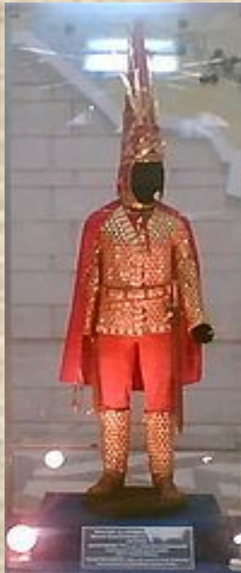
АЛТЫН адам, Есік обасы