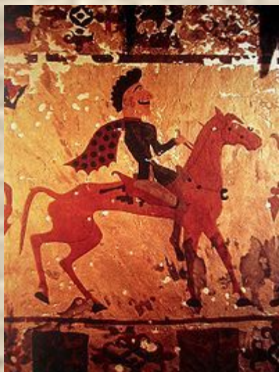
Пазырық обасынан табылған аттылы сақа кескіні