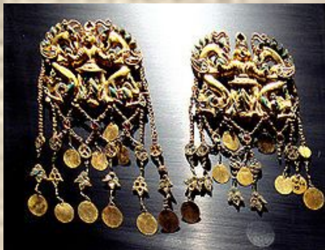
Тиллә тепеден табылған алтын әшекейлер