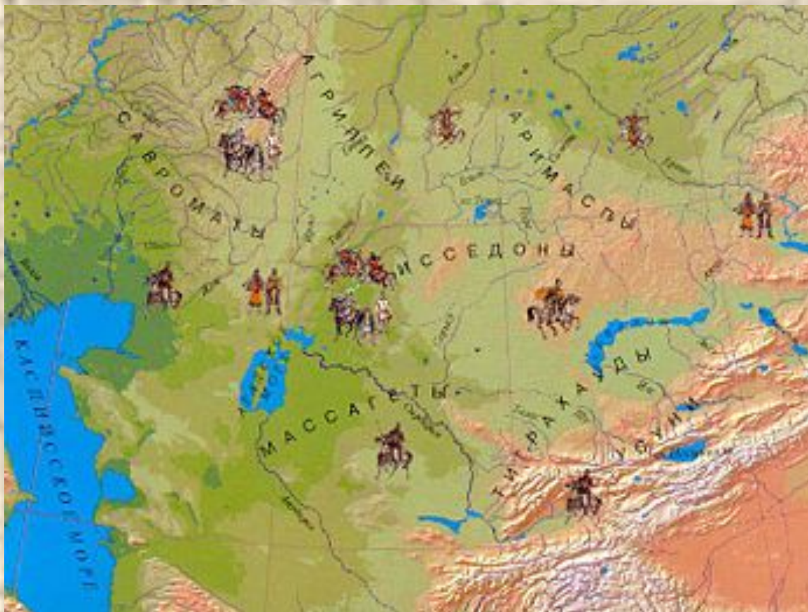
Сақ тайпалары мекендеген территория аумағы