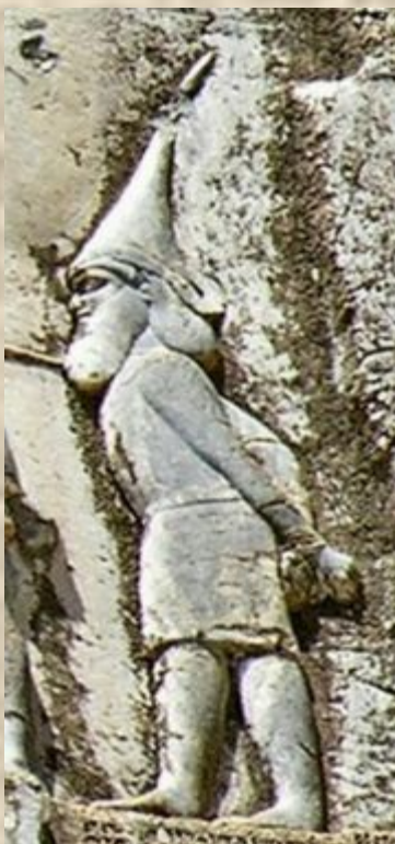
Парсыларға тұтқынға ұсталған сақтардың Сқунха деген көсемі