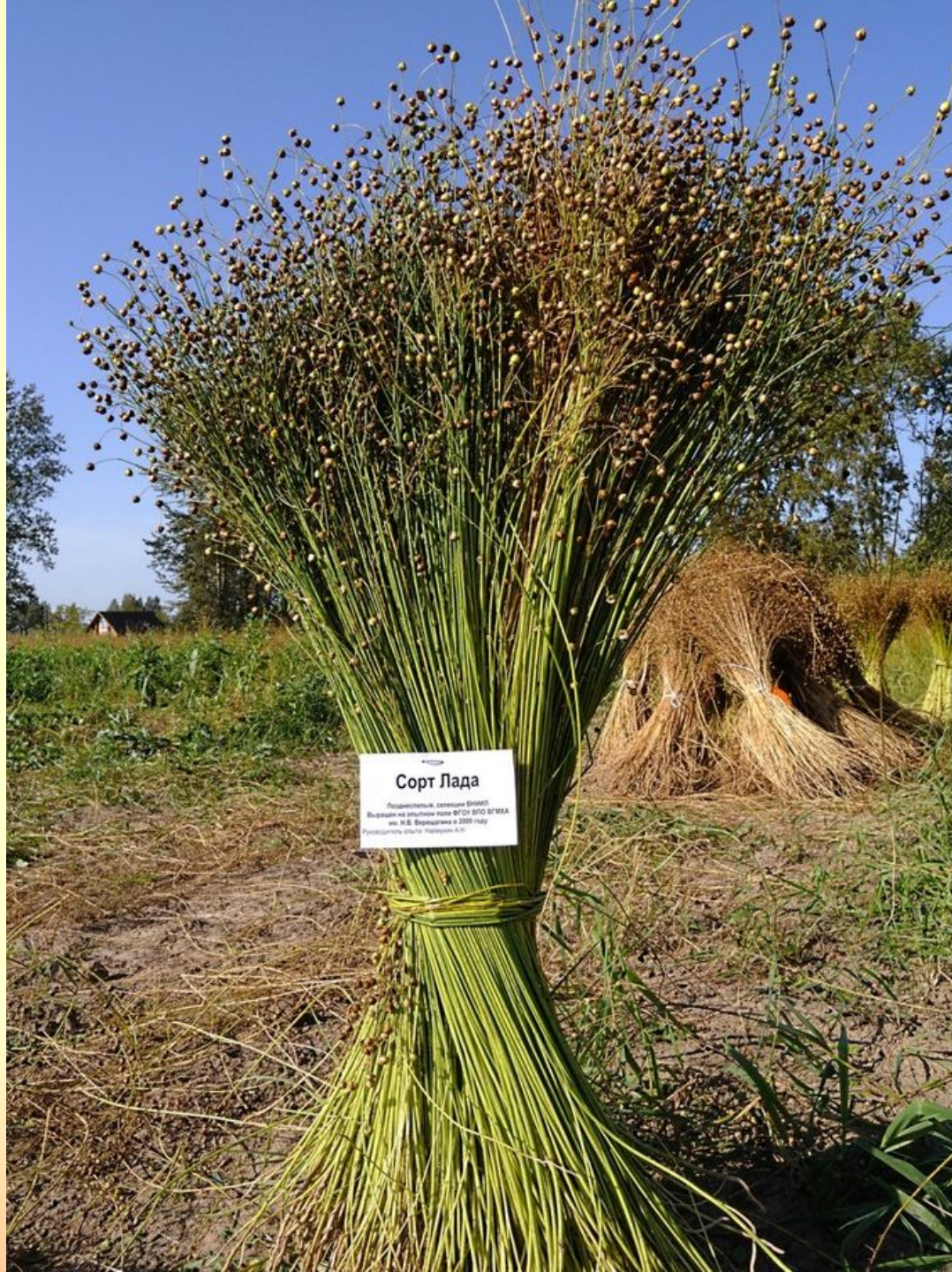
Сорт Лада Полосатый, семена 010007 Выявлен на опытной поле ФГОУ ВПО ВГМУА им. Н.Д. Березина в 2009 году Регистрация селек. материала отсутствует