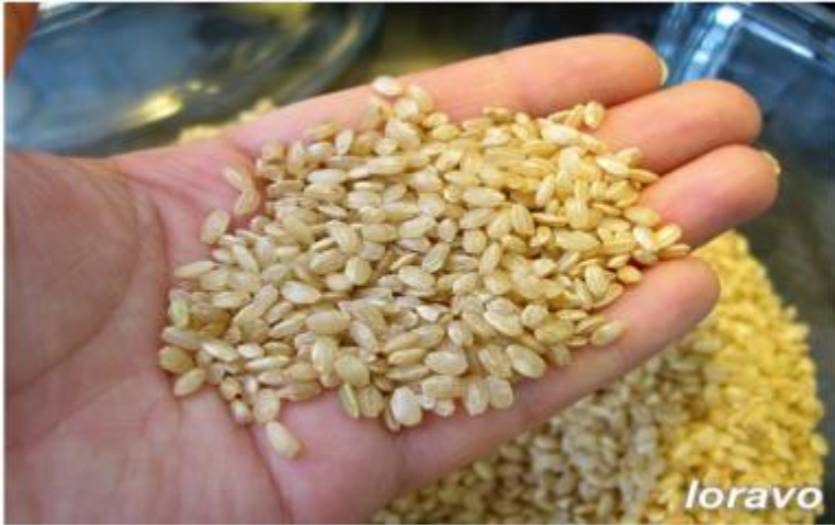
Рис - 9/10 мирового сбора приходится на страны Азии - Китай, Индию, Индонезию, Японию