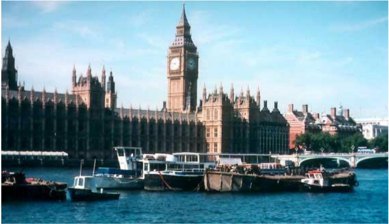
Биг Бен и здания британского парламента