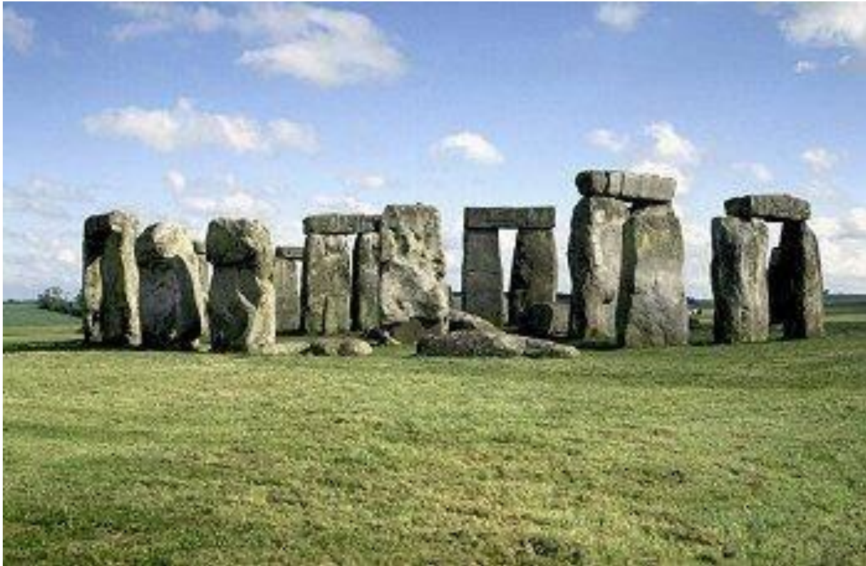
Стоунхендж - доисторическое собрание каменных глыб на юго-западе Англии