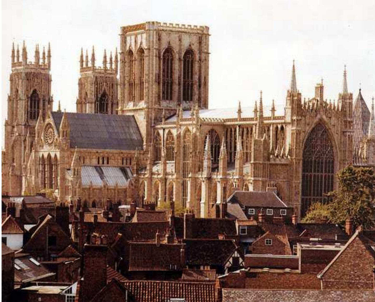
Кафедральный собор в Йорке, признанный крупнейшим готическим собором в Северной Европе