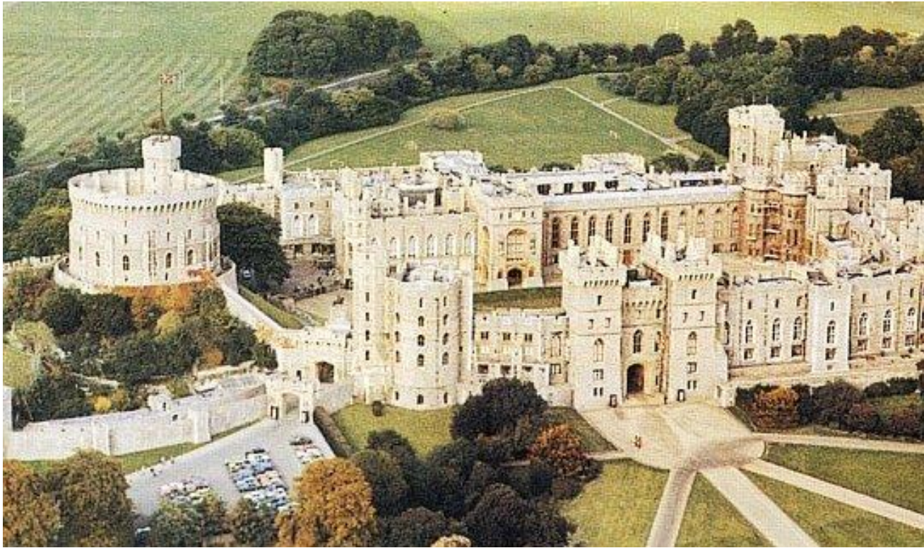
Виндзорский замок, крепость с тысячелетней историей и официальная резиденция британской королевы