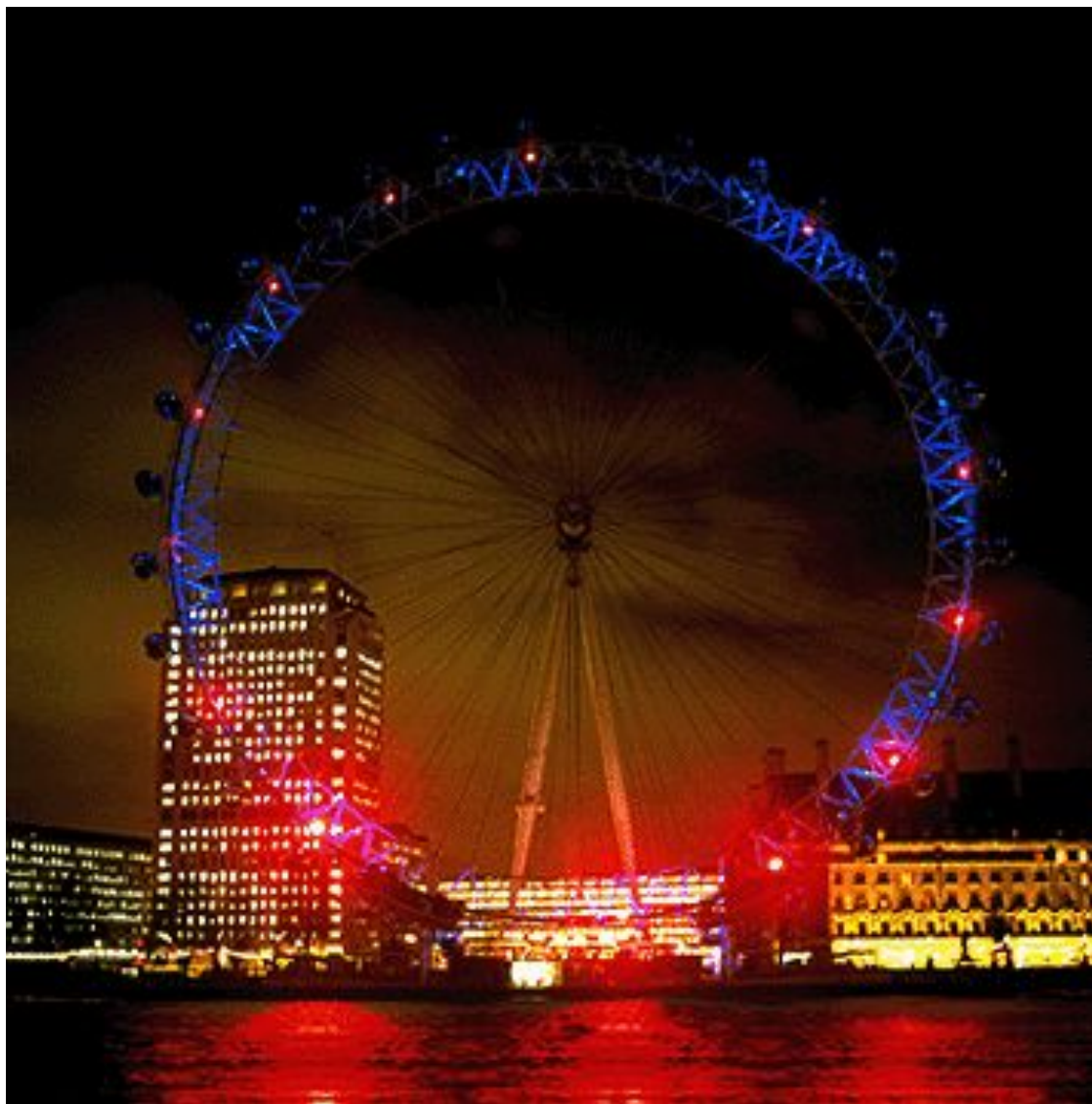
Колесо обозрения "Лондонский глаз", воздвигнутое в конце 1999 года на южном берегу Темзы