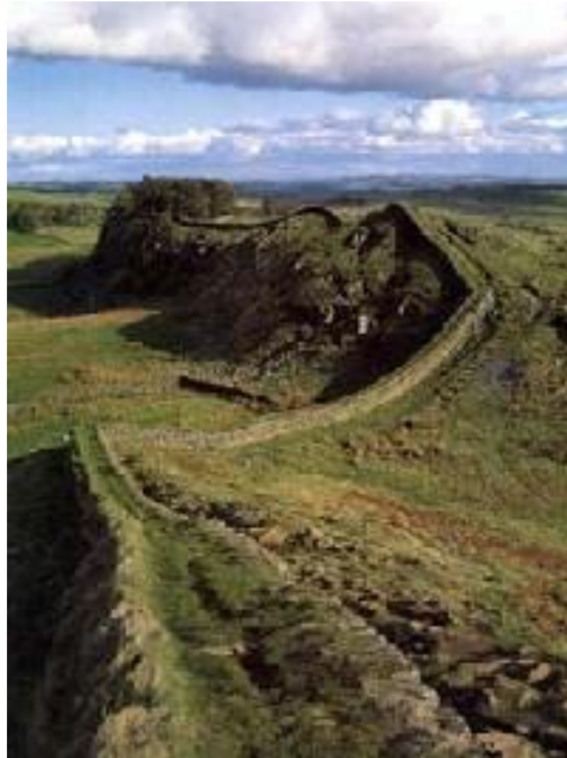
Адрианов вал, отделяющий Англию от Шотландии, II в. н.э., колоссальное оборонительное сооружение длиной 117 км