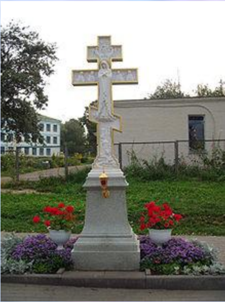
Крест у начала Святой канавки

25 ноября 1825 года Богородица явилась преподобному Серафиму и повелела основать Мельничную общину, указав как следует обнести это место канавой и валом. Копать Канавку должны были только сестры общины, а миряне могли помогать носить землю и насыпать вал.