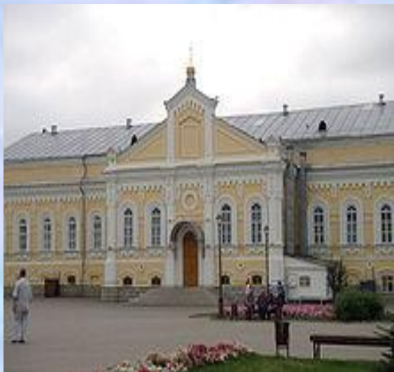
Трапезный храм во имя святого благочестивого князя Александра Невского

В обители проживает более 400 насельниц. С 1989 года в Дивееве было восстановлено и освящено семь храмов. Центром духовной жизни остается Троицкий собор со своей главной святыней — святыми мощами преподобного Серафима, Саровского чудотворца.