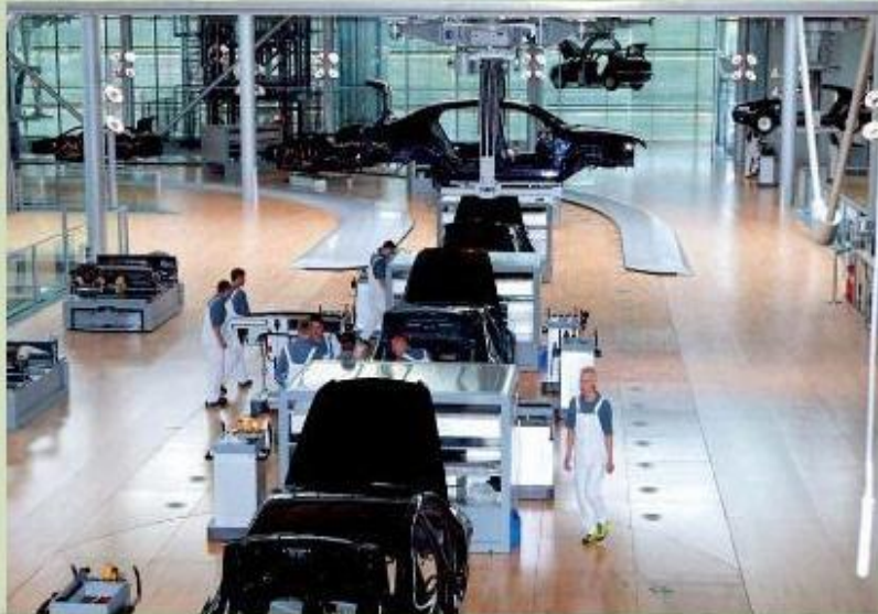
Сборочный цех «Мерседесов» на автомобильном заводе ФРГ.

Каменный уголь и железная руда - основа для развития черной металлургии, крупнейшие предприятия которой («Тиссен и Крупп») возникли еще в XIX веке.