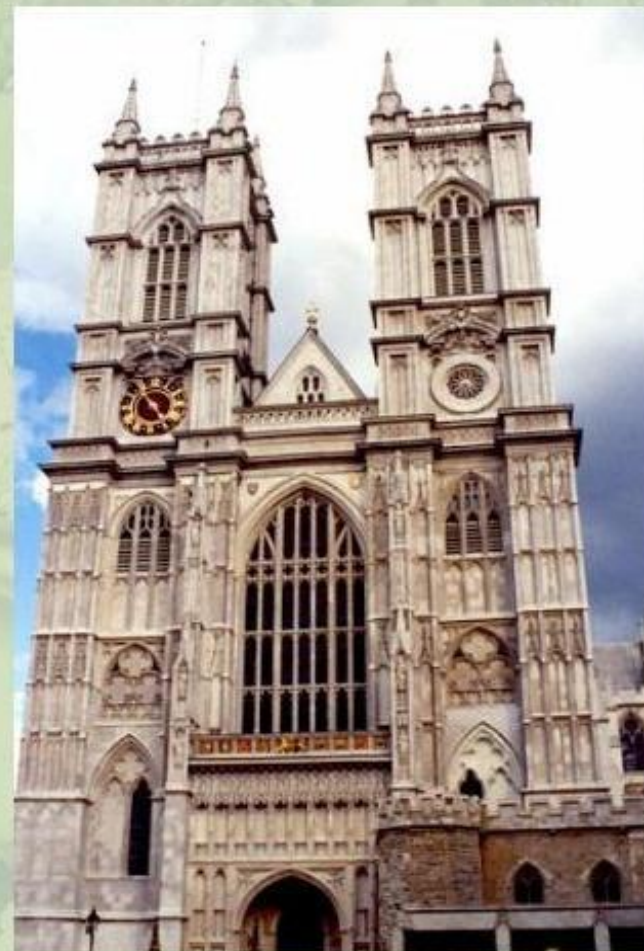
Вестминстерское аббатство в Лондоне.