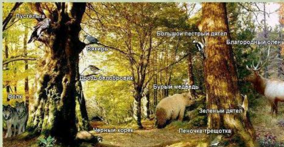
Животные широколиственных лесов Европы.

В прошлом густые широколиственные леса покрывали равнины. В течение длительного времени ландшафты равнин активно осваивались человеком и неузнаваемо изменились. На обширных пространствах на месте лесов появились города и сельские поселения, поля и сады, проложены автомагистрали и трубопроводы. Первичные леса сохранились небольшими массивами, которые называют пущами . Среди таких массивов - известный заповедник Беловежская Пуща, который расположен на территории Польши и Белоруссии. Здесь охраняют некогда широко распространенных в европейских лесах зубров и оленей, а также других животных.