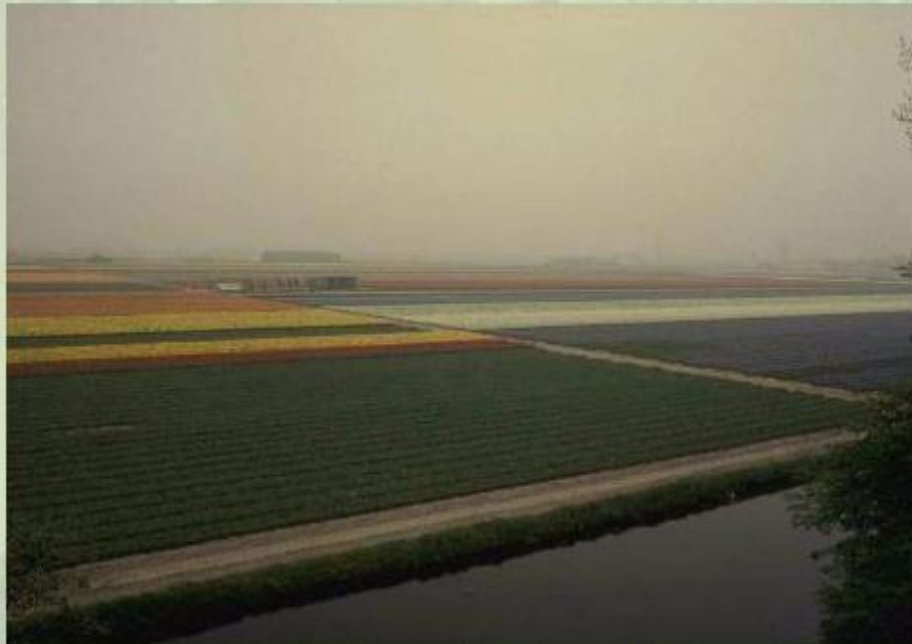
Поля тюльпанов на осушенном морском дне (польдерах) у берегов Голландии.

Низменные пространства на побережье Нидерландов называют маршами . 40% территории этой страны лежат ниже уровня моря, еще 30% - на высоте всего 1 м над уровнем моря.