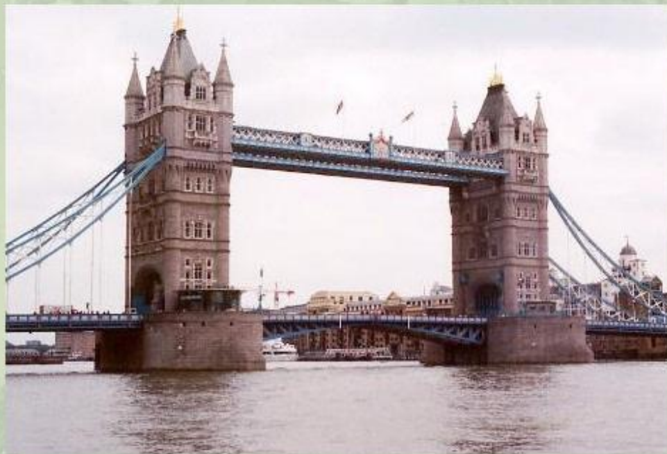
Тауэрский мост в Лондоне.