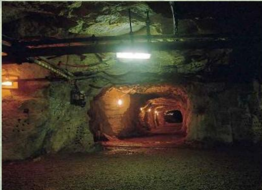
Шахта в Рурском угольном бассейне.