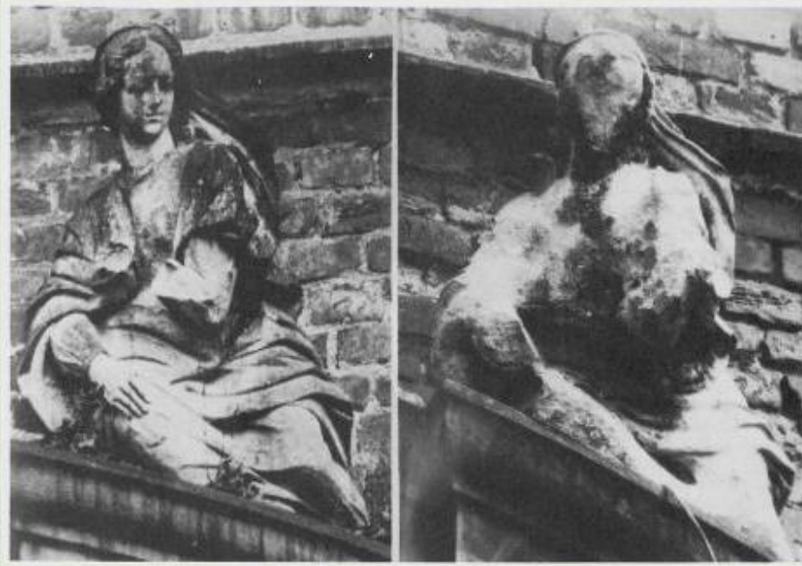
Мраморные статуи до и после кислотных дождей.

Промышленная и городская застройка «съедают» продуктивные земли, транспорт и предприятия энергетики загрязняют воздух и воды. Миллионы тонн серной и азотной кислоты выпадают в виде кислотных дождей , сжигая хвою, листву и ветви деревьев, окисляя почвы, разъедая каменное кружево произведений европейской архитектуры, загрязняют реки. Воды рек и озёр, отравленных промышленными стоками, сегодня подвергаются очистке. В Рейне вновь появилась рыба и, возможно, скоро река будет оправдывать свое название, которое переводится с немецкого языка как «чистый».