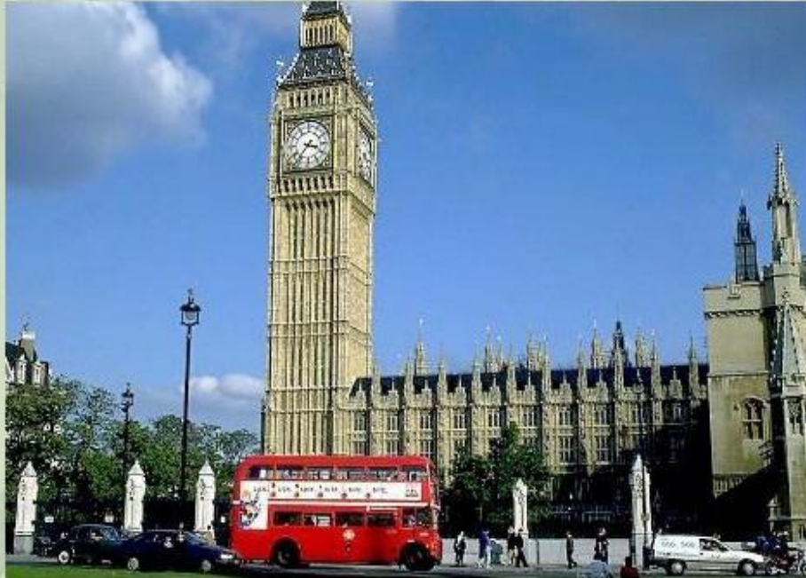
Знаменитая часовая башня Биг-Бен.

Великобритания состоит из нескольких исторических областей. На юге страны располагается историческое ядро страны - Англия. Здесь находится самый большой город, столица страны, порт на реке Темзе - Лондон, окруженный крупнейшей агломерацией .