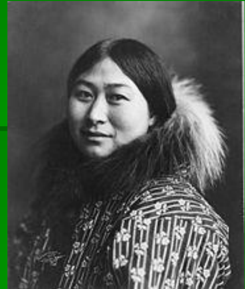
Э с к и м о с к а