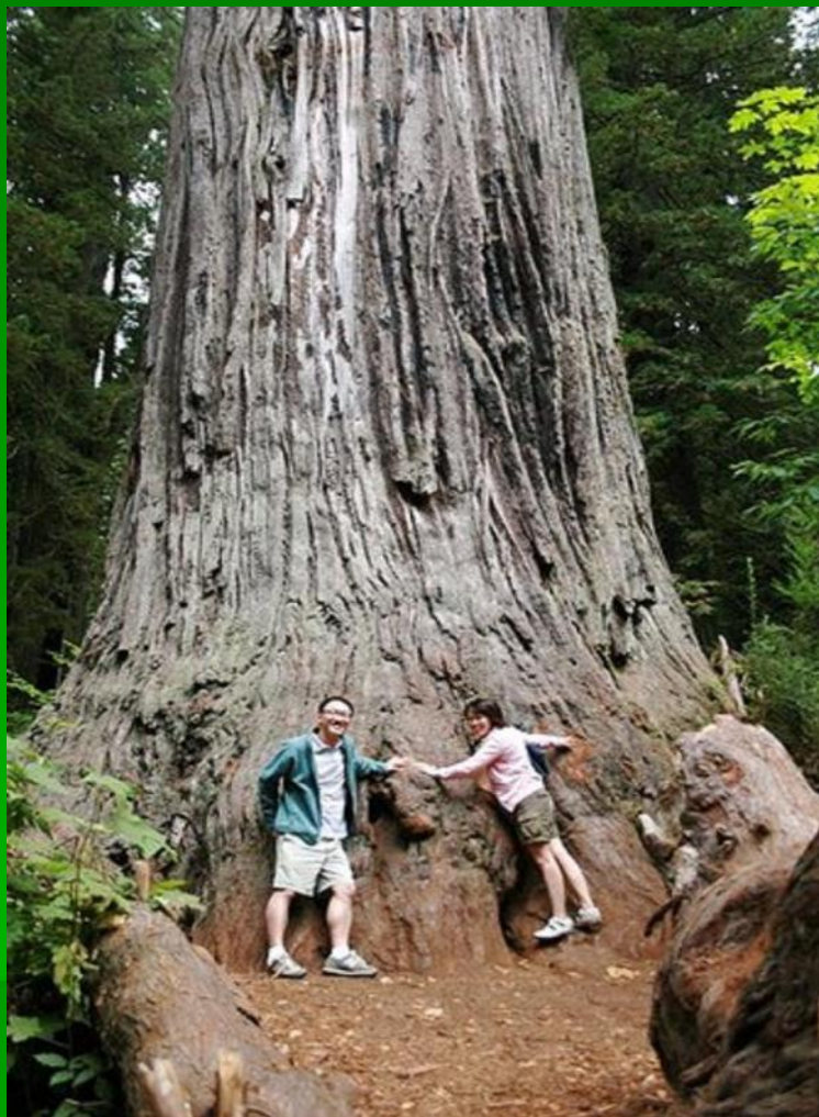
Секвойя в Национальном парке

Некоторые виды секвойи доживают до 4000 лет