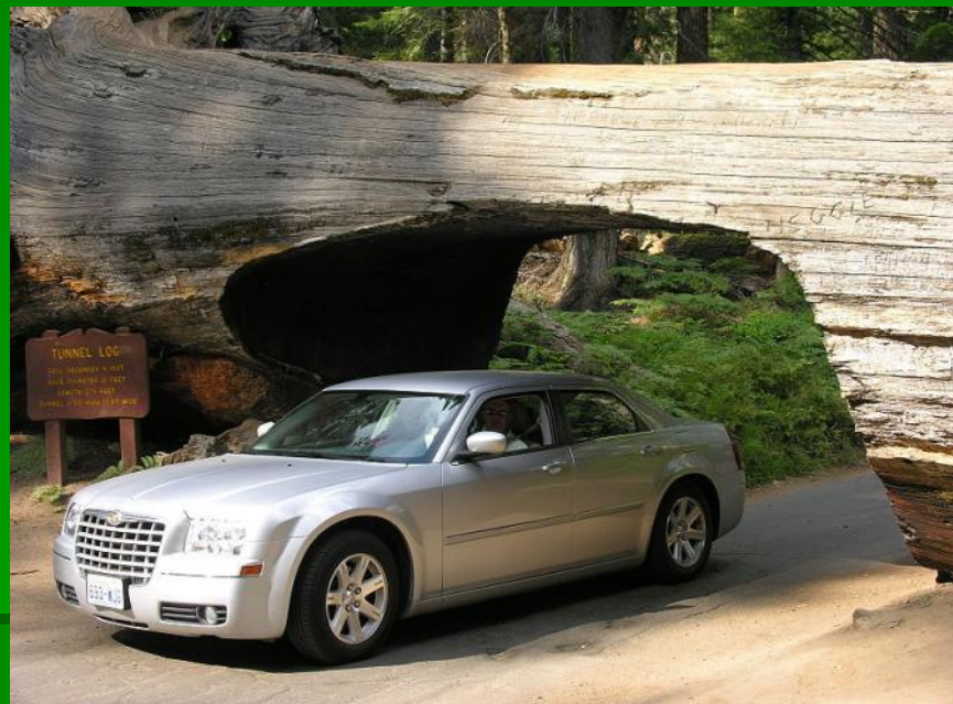
Тоннель в стволе секвойи

Некоторые виды секвойи доживают до 4000 лет