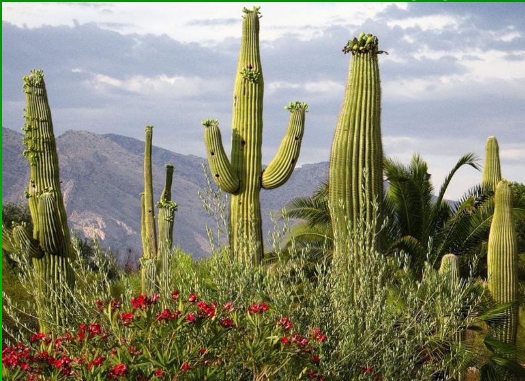
Кактусы Мексиканского нагорья

Какая природная зона не образует сплошной полосы, а напоминает мозаику, где преобладают кактусы и агавы?