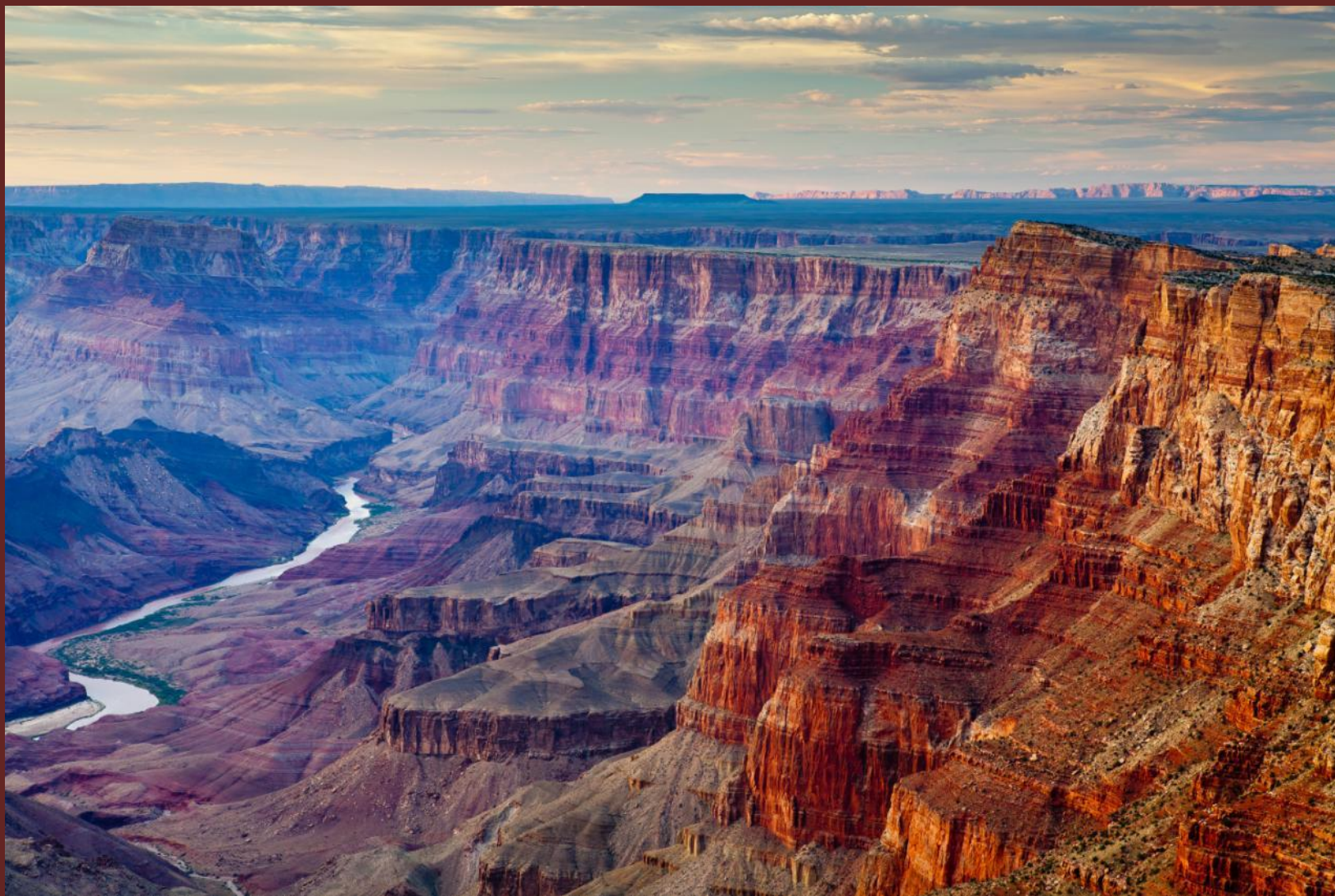
Большой каньон Колорадо