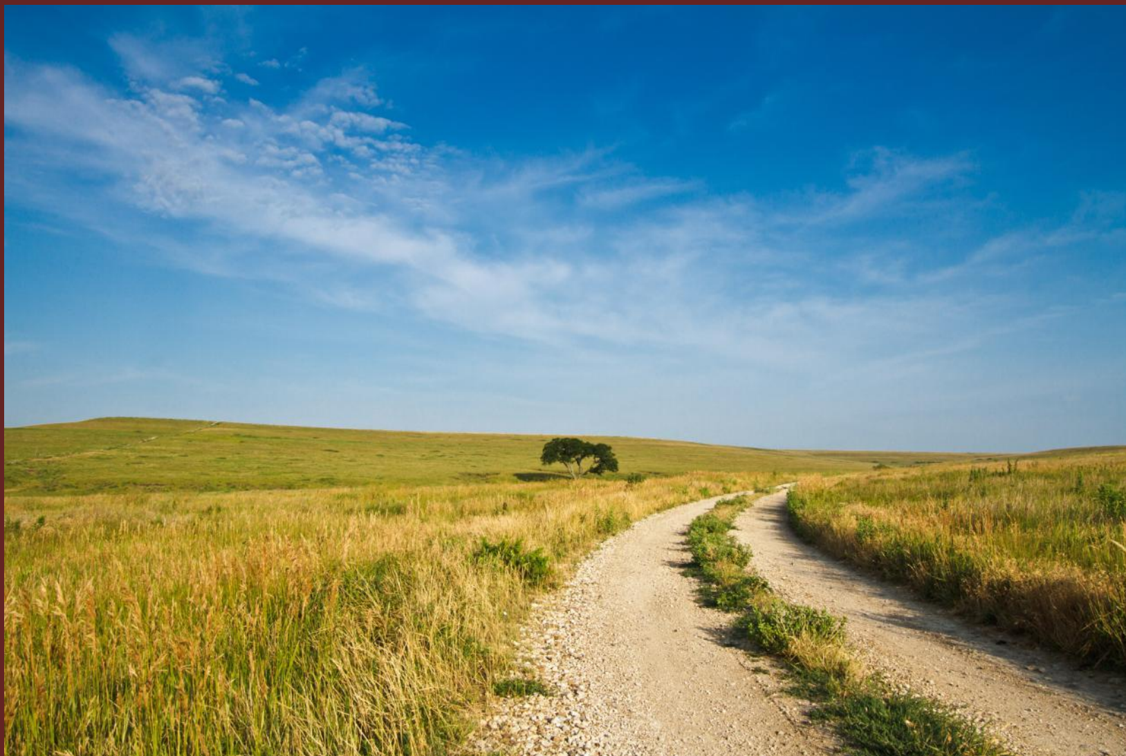
Центральные равнины в Канзасе