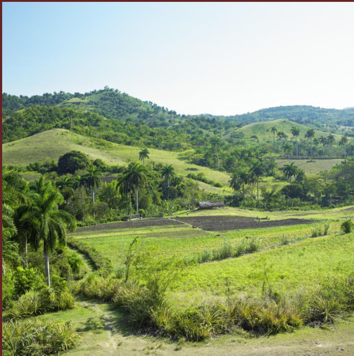
Ландшафт провинции Ольгин (Куба)