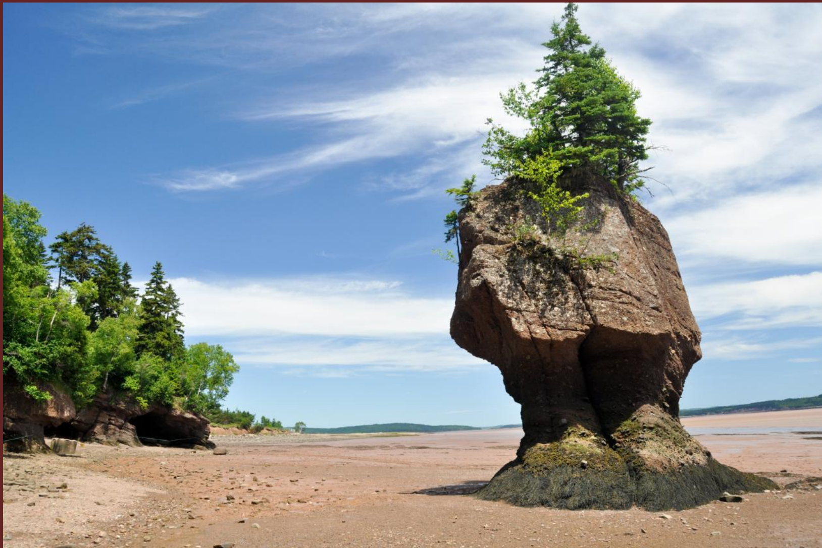
Отлив в заливе Фанди