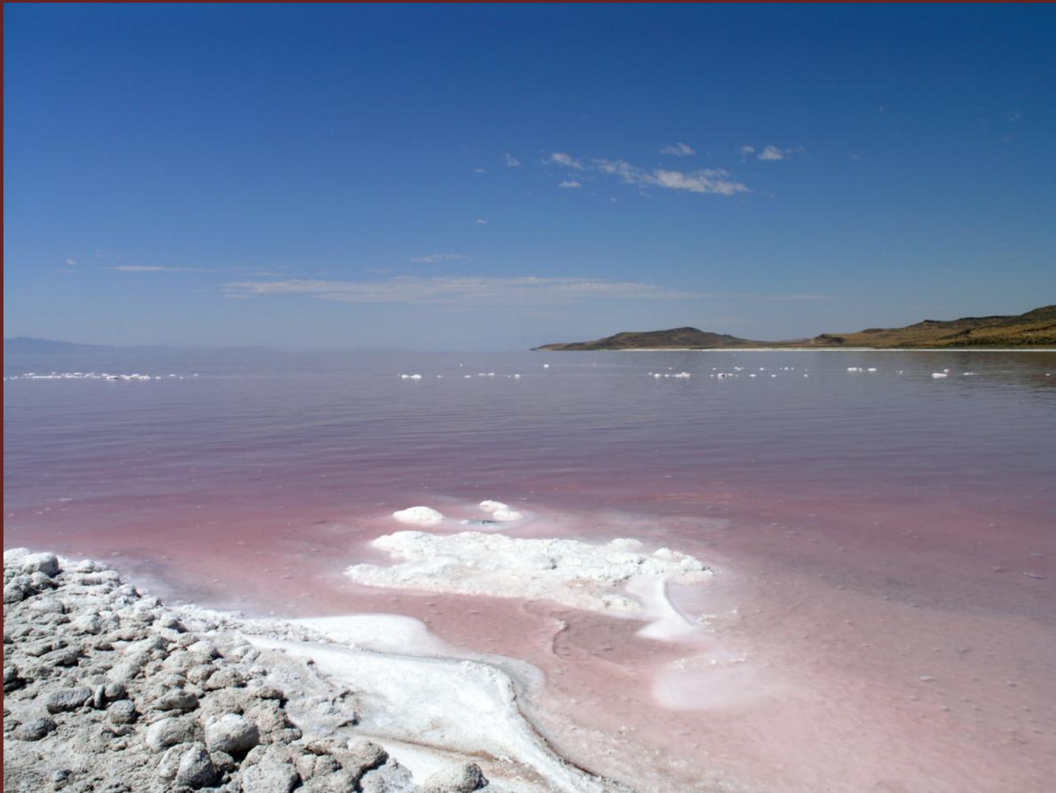
Большое Солёное озеро