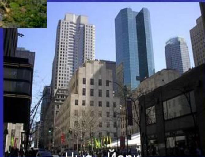
Нью - Йорк