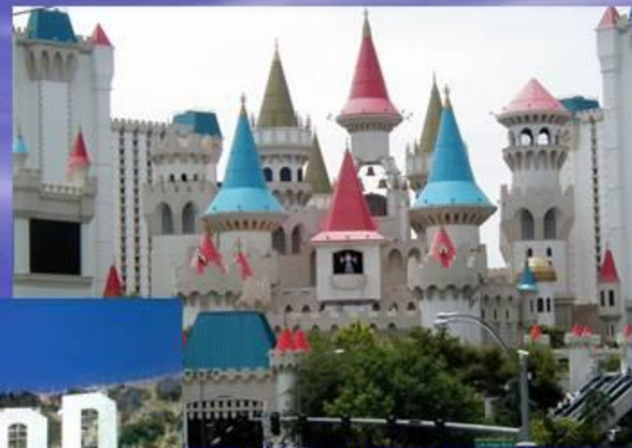
Лас - Вегас