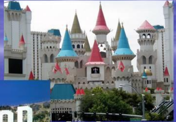
Лас - Вегас