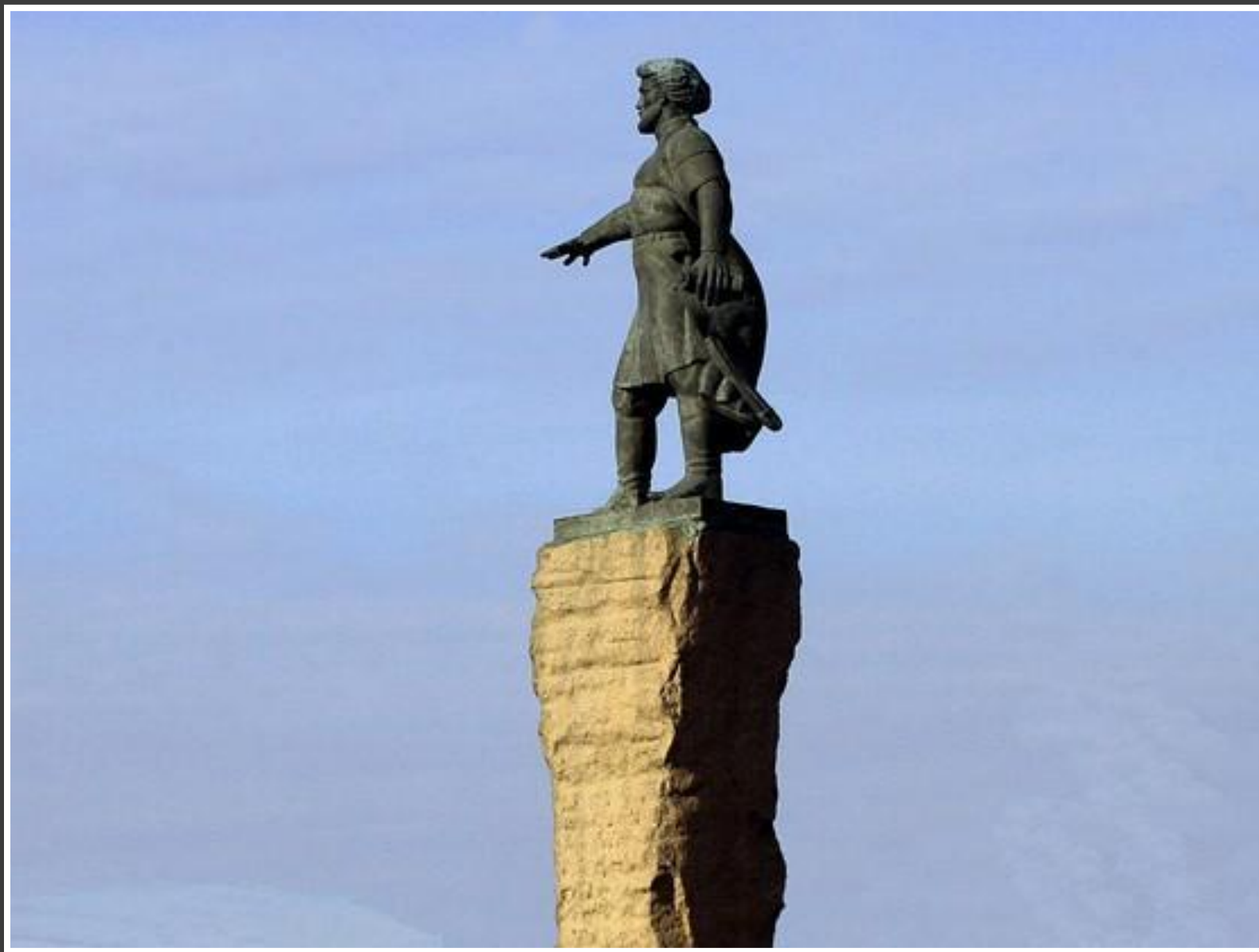
Памятник Андрею Ануфриевичу Дубенскому(Советский р-н)