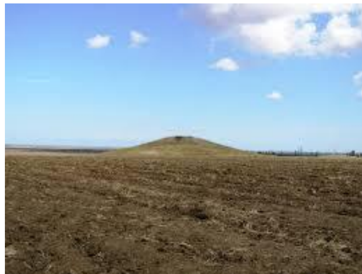
Курган – могила царицы