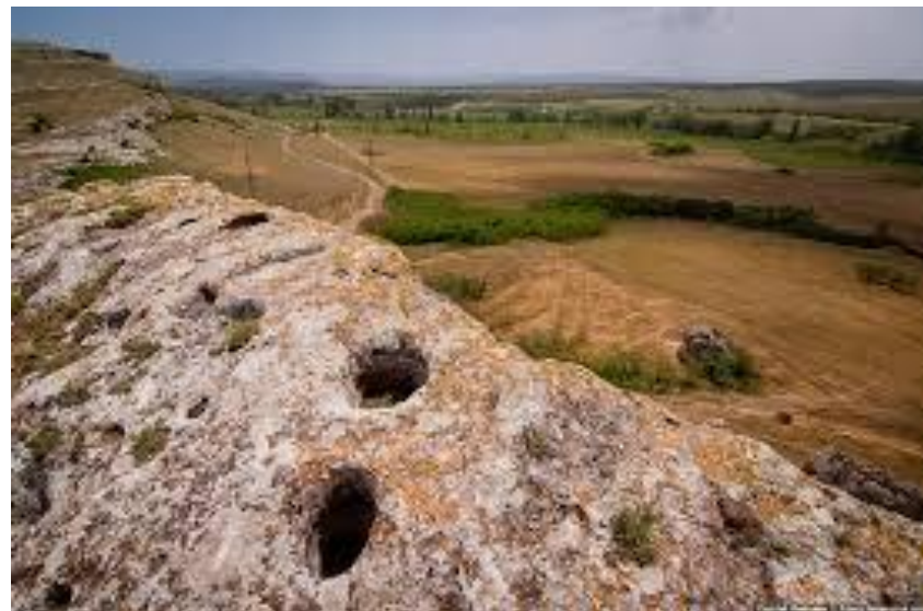
Стоянки первобытного человека