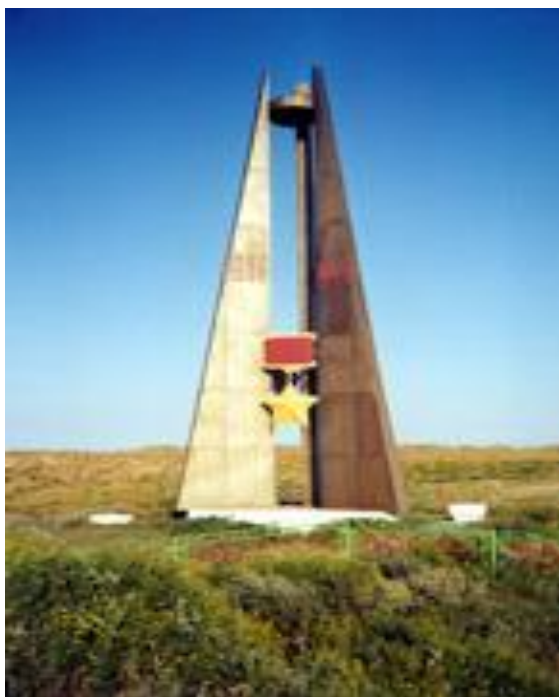
Памятник, посвященный трем штурмам Перекопа

В 1963 году начался третий, мирный штурм Перекопа. На засушливые земли севера Крыма пришли воды Днепра – вступил в строй Северо-Крымский канал