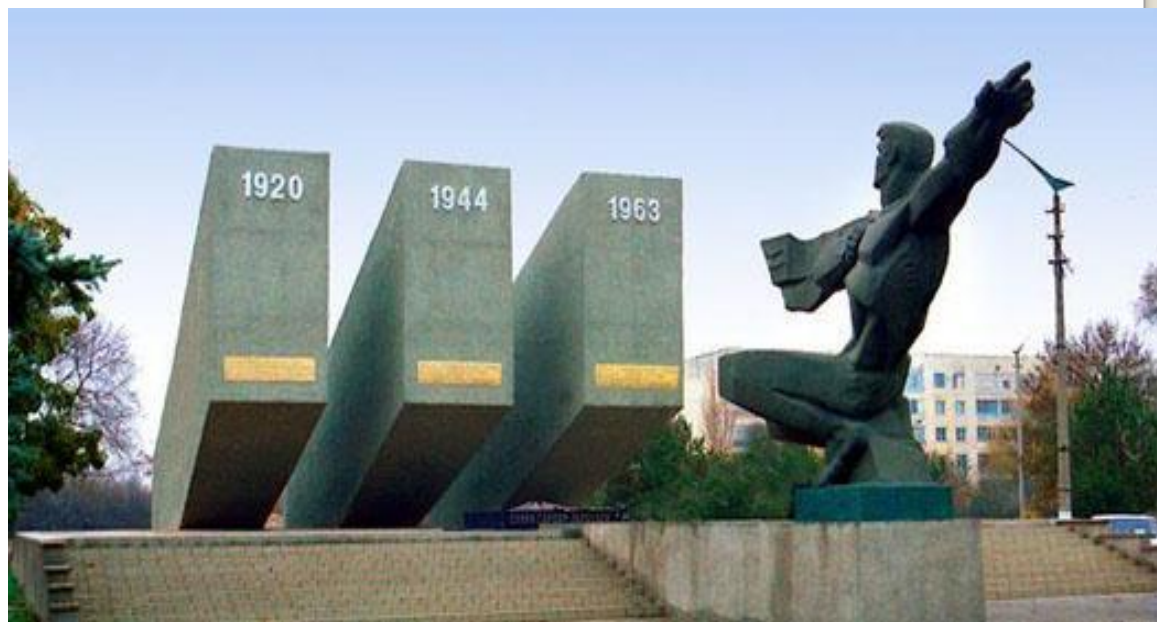
Мемориал «Три штурма Перекопа», г. Красноперекопск