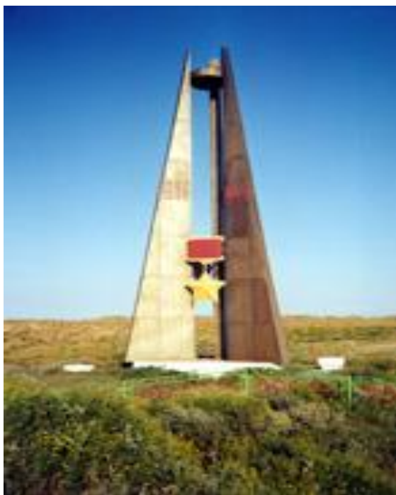
Памятник, посвященный трем штурмам Перекопа

В 1963 году начался третий, мирный штурм Перекопа. На засушливые земли севера Крыма пришли воды Днепра – вступил в строй Северо-Крымский канал