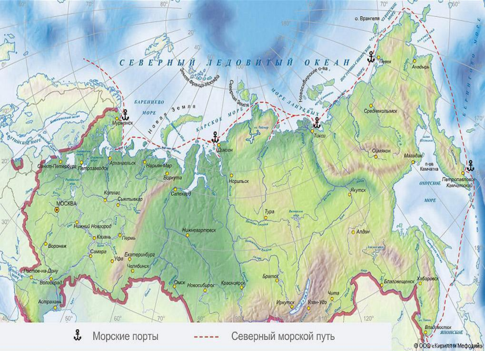
Северный морской путь. Географическая карта.