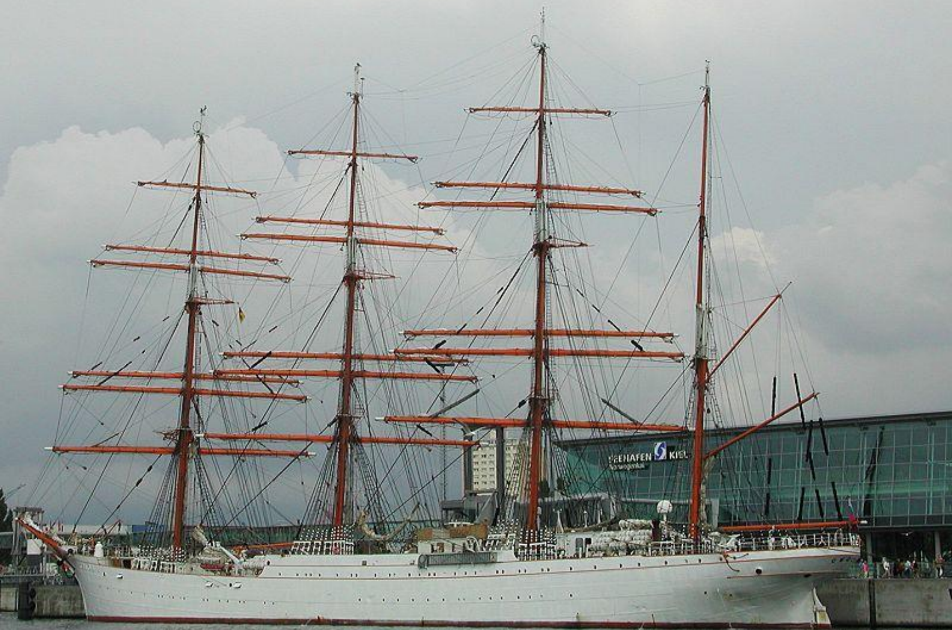
Барк «Седов» в Мурманске.