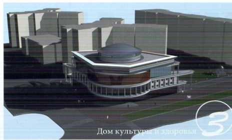
Дом культуры и здоровья