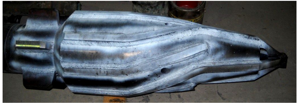
14 ¾ д. Конусты фреза