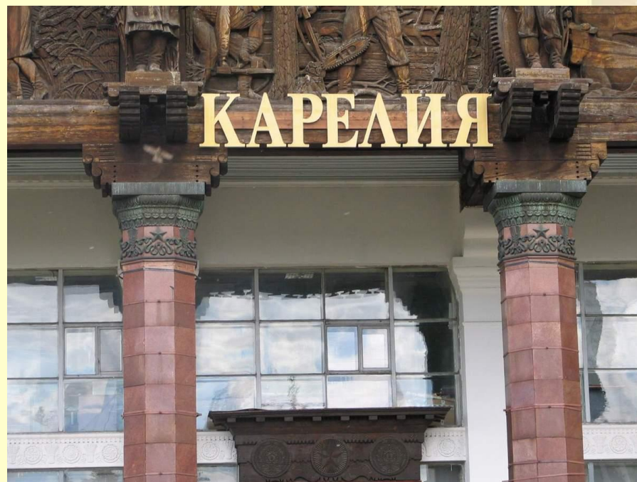
Павильон КАССР на ВДНХ. Фото 60-х гг. XX века