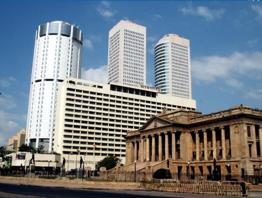
Colombo World Trade Center в Коломбо

Рост ВВП около 5 % в год. Шри-Ланка занимает 1-е место в Южной Азии по объёму ВВП на душу населения ($4300 в 2008 году).